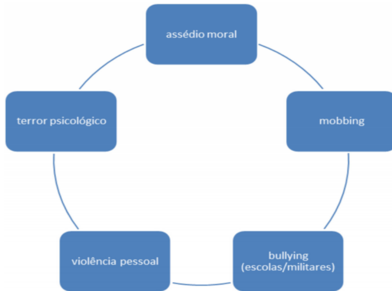
Figura 1: Representação gráfica das terminologias referentes ao assédio moral

Para Einarsen (2003, p. 25): Embora os conceitos de bullying (usado em países de língua inglesa) e mobbing, (usado em muitos países europeus) possam ter algumas diferenças semânticas e conotações, referem-se basicamente ao mesmo fenômeno.