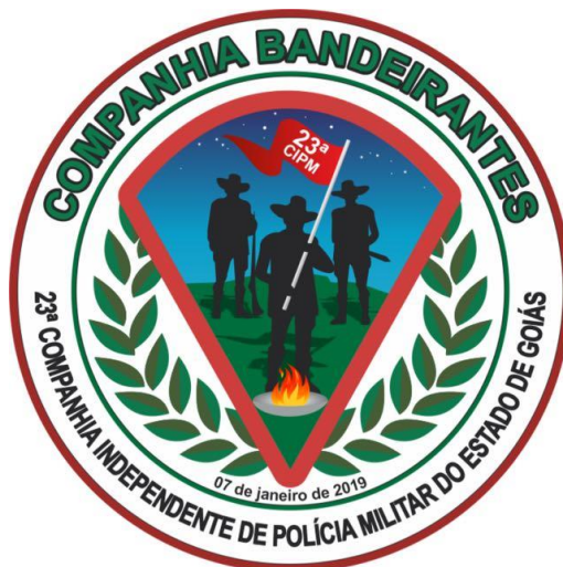
Figura 1 – Brasão da Companhia.

Atualmente o Brasão da companhia apresenta valores de suas raízes e cultura influenciada por parte dos bandeirantes e da história da localidade. Sendo o Brasão uma importante imagem e referencia de identificação da companhia que expõe seu orgulho e serve de apresentação.