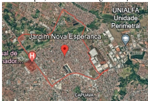
Figura 1 – mapa do bairro jardim nova esperança, em

O bairro jardim Nova Esperança é um bairro localizado no município de Goiânia, capital de Goiás, na região noroeste da cidade. Nesse sentido, o 13º batalhão de polícia militar é o responsável pelo policiamento nesse bairro. maior parte da população é de média e baixa renda. Sua história iniciou-se com a invasão de uma propriedade rural (Fazenda Caveiras), ocorrida em 1979. Desde então, o bairro Jardim Nova Esperança tem evoluído em termos populacionais e urbanos, enfrentando desafios e mudanças característicos de muitos contextos urbanos em crescimento. Segundo dados do censo do IBGE em 2010, é o décimo quinto bairro mais populoso do município, contando uma aglomeração de cerca de quinze mil pessoas.