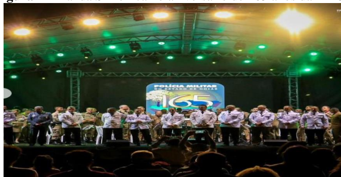
Figura 2 – Banda Sinfônica no aniversário de 165 anos da PMGO

O repertório tocado pela Banda Sinfônica é bastante diversificado. Desde 2019, observa-se que músicas populares de diversos estilos musicais como sertanejo, MPB, chorinho, samba, pagode, rock têm sido executadas pela Banda Sinfônica. Ademais, o repertório erudito também tem sido objeto de execução desse grupo, além de músicas de origem orquestral como a abertura da ópera O Guarany de Carlos Gomes. Isso se deve ao fato da grande variedade de instrumentos usados nessa formação e também aos diversos arranjos musicais, muitos deles, produzidos pelos próprios policiais militares músicos do Estado de Goiás, o que enriquece a cultura goiana.