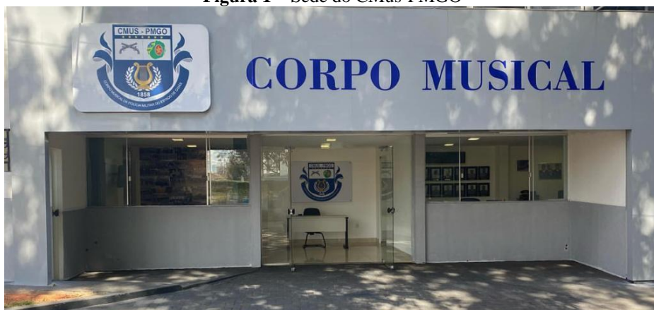
Figura 1 – Sede do CMus-PMGO

Ao analisar as competências previstas no regimento interno do CMus-PMGO percebe-se a amplitude de possibilidades de atuação desse braço da PMGO.