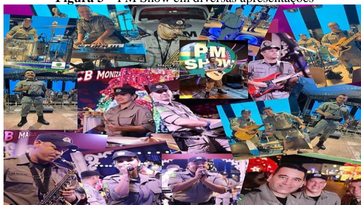
Figura 3 – PM Show em diversas apresentações

O instrumental utilizado varia conforme o gênero musical tocado, mas, basicamente, a PM Show é composta por violão, viola caipira, guitarra, bateria e percussão, vozes e teclado. Além disso, o grupo é formado por menos policiais músicos, que varia entre 5 e 10.