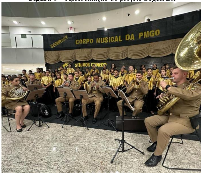
Figura 6 – Apresentação do projeto SegurArte