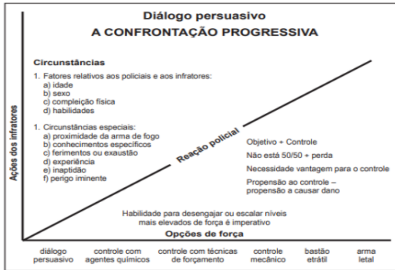
Ilustração 1 – Modelo de Uso da Força por Dr. Kevin Parsons, em 1980.