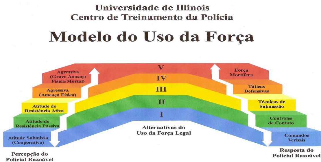
Ilustração 2 – Modelo de Uso da Força FLECT

danosa. A cor vermelha, a última da lista, refere à ameaça mortal (Barbosa e Ângelo, 2001). Conforme se observa na ilustração abaixo: