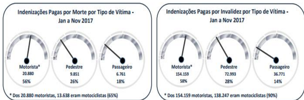
Gráfico 1: Indenizações pagas por morte e invalidez