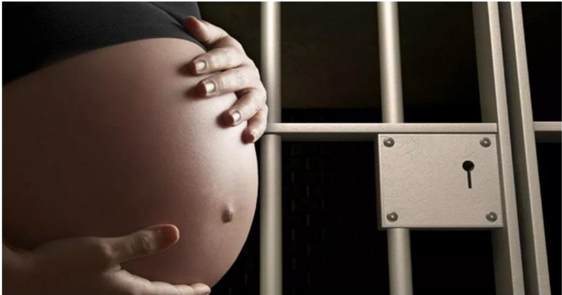
Figura 1- Detentas grávidas ou que estão amamentando poderão ter prisão domiciliar