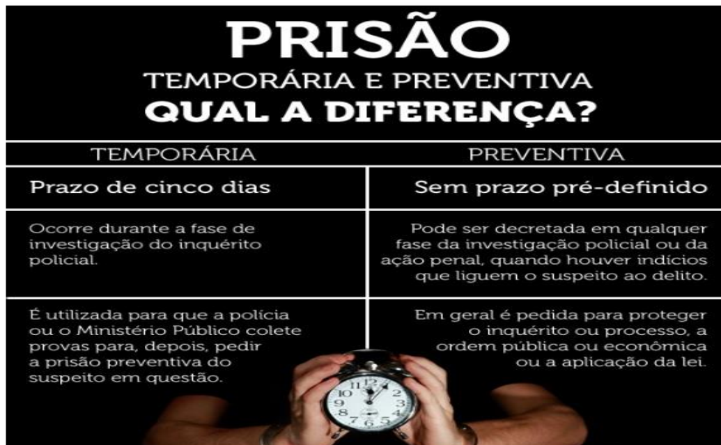
Figura 2- Diferença entre prisão temporária e preventiva