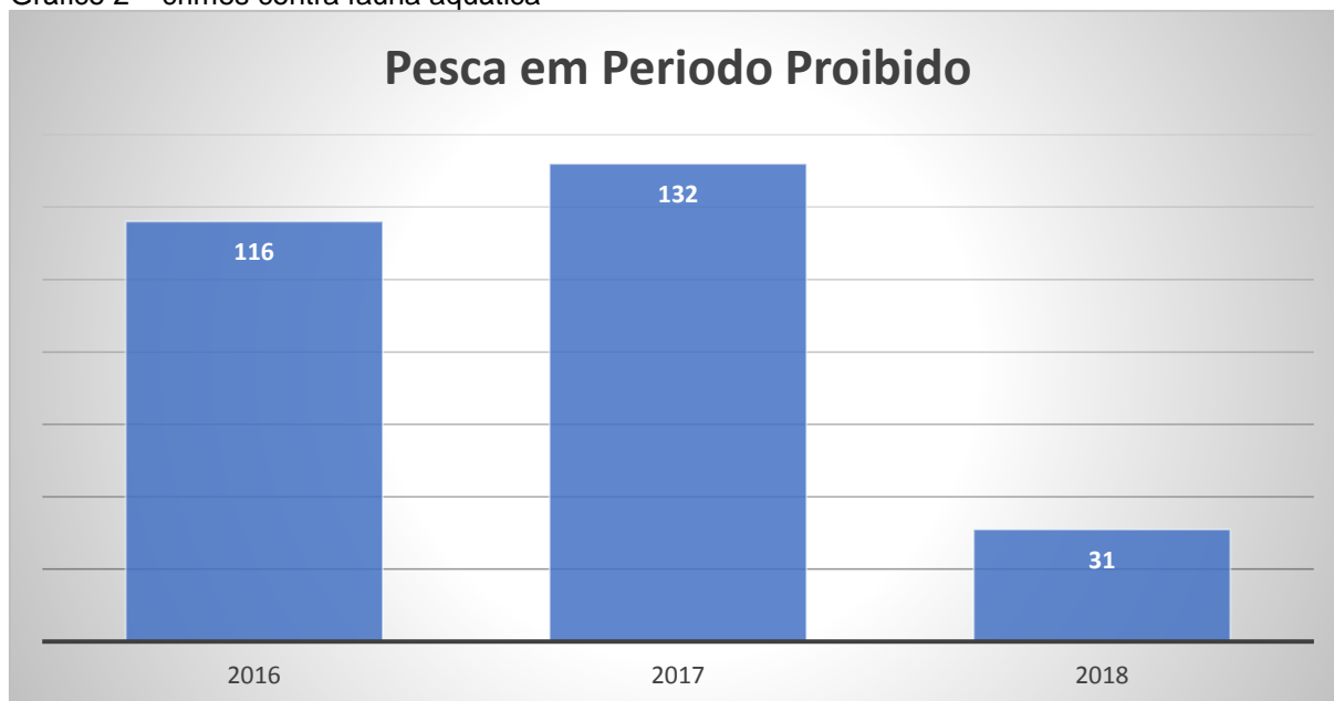
Gráfico 2 – crimes contra fauna aquática