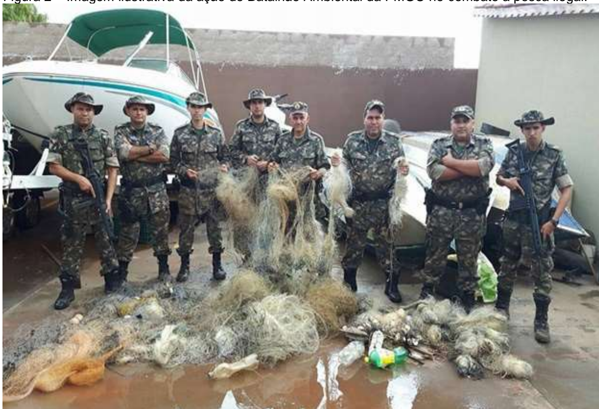
Figura 2 – Imagem ilustrativa da ação do Batalhão Ambiental da PMGO no combate a pesca ilegal.