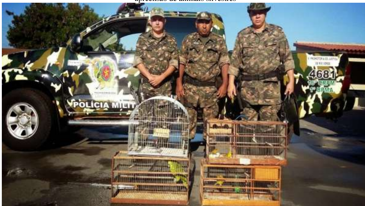
Figura 1 – Imagem ilustrativa da ação do Batalhão Ambiental da PMGO na cidade de Jataí-GO, durante a apreensão de animais silvestres