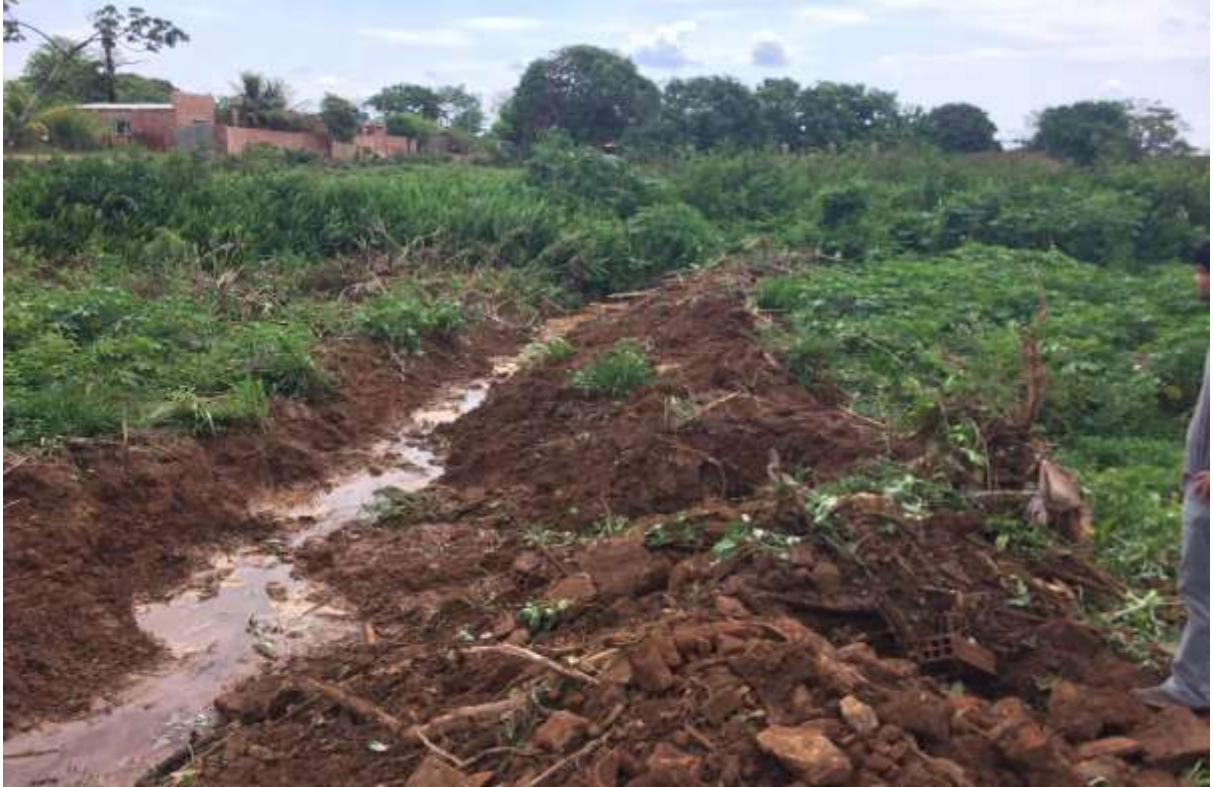
Figura 3 – Polícia militar ambiental de Goiás no combate a área de preservação permanente em Jussara – GO.