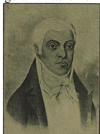
Figura 1: Paulo Fernandes Viana, primeiro intendente-geral.

A primeira instituição policial criada no Brasil foi a Intendência-Geral de Polícia da Corte, criada em 1808, no Rio de Janeiro, suas missões eram cuidar da capital brasileira da época e garantir a ordem pública. Cabe ressaltar que esta realizava as atribuições de investigação e captura dos criminosos. Segundo Costa (2004), a função de intendente-geral concedia o cargo de desembargador a quem a ocupasse, quem era designado para esta função tinha autoridade para prender e podia também julgar e punir pessoas acusadas de delitos menores, se equiparando assim a um juiz. E só com a Constituição de 1824 que se criou a figura de um juiz de paz, que na época era eleito pela população, para desempenhar as funções anteriormente atribuídas ao intendente-geral de polícia. Porém de acordo com o autor essa figura de um juiz de paz durou somente até a reforma do Código de Processo Penal de 1841, onde os juízes de paz são substituídos por funcionários de polícia pelo governo central, e novamente uma autoridade de polícia passa a acumular as funções policiais e judiciárias. E somente com o Código de 1871 que de fato se deu a retirada das funções judiciárias das mãos dos chefes e delegados de polícia.