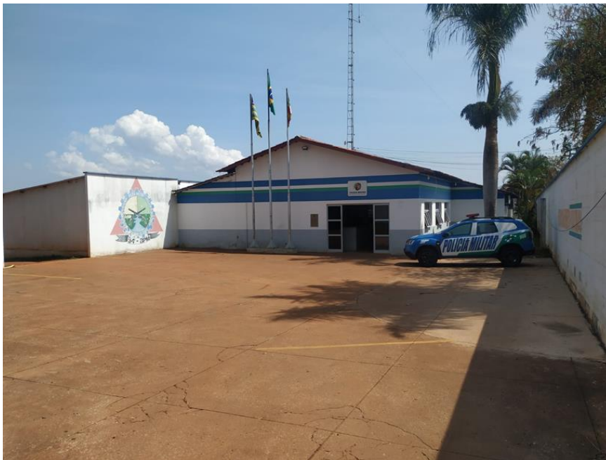
Figura 10: Fachada atual do 34º BPM