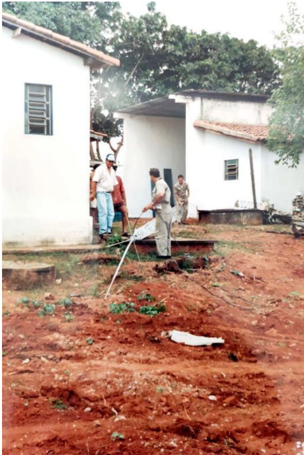
Figura 5: Obras para ampliação das instalações do 34º BPM