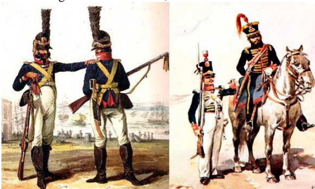
Figura 2: Guarda Real, infantaria e cavalaria.

Fonte: https://gestaodesegurancaprivada.com.br/policia-militar-do-brasil-atribuicoes/(2023)