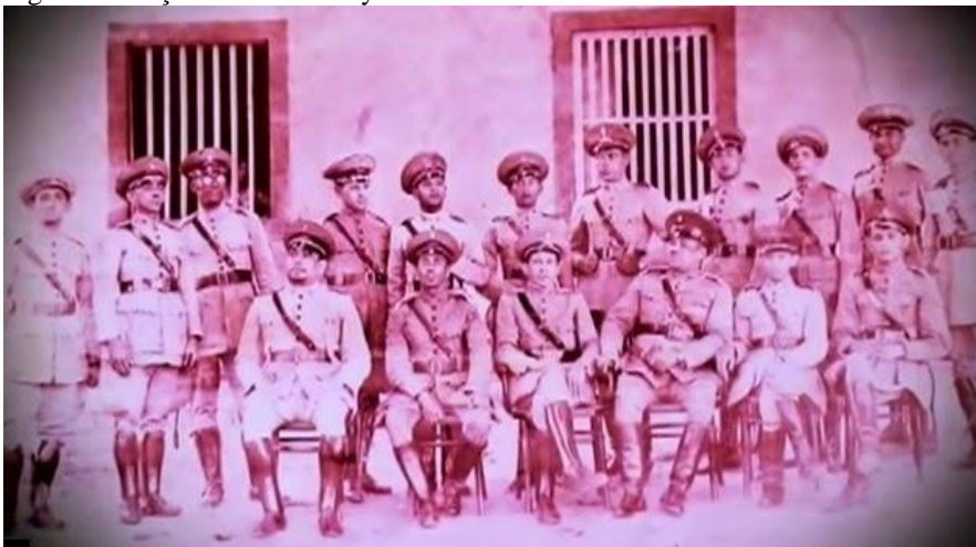
Figura 3: Força Policial de Goyaz