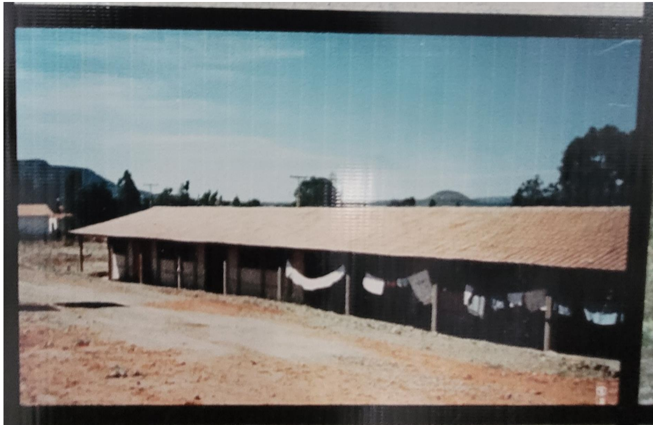
Figura 4 - Antiga estrutura do 24º Batalhão