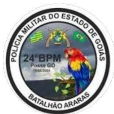
Figura 2 – Brasão do 24ºBPM