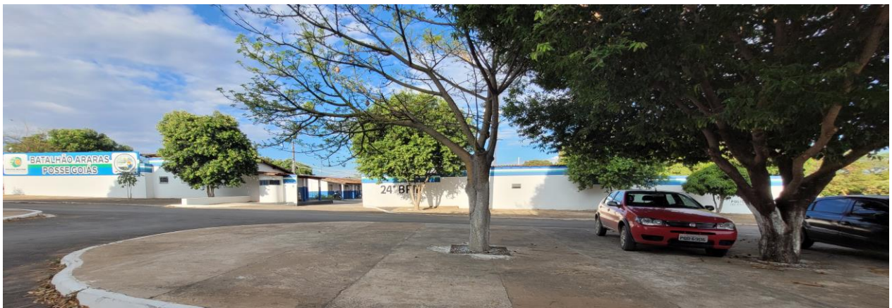
Figura 8 – Atual fachada da unidade

Por fim, é válido ressaltar a importância do legado que o Batalhão Araras tem na sociedade em que está presente, principalmente aos policiais militares que fizeram e fazem parte da história dessa OPM e também a toda sociedade que apoia o trabalho da polícia. Há que se falar também, nos veteranos, que fizeram uma grande trajetória nos anos em que estiveram no serviço ativo da polícia militar (Resposta policial nº 2).