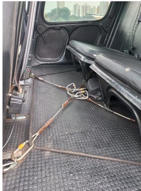
Figura 5: “Aranha” conecta os cabos de segurança