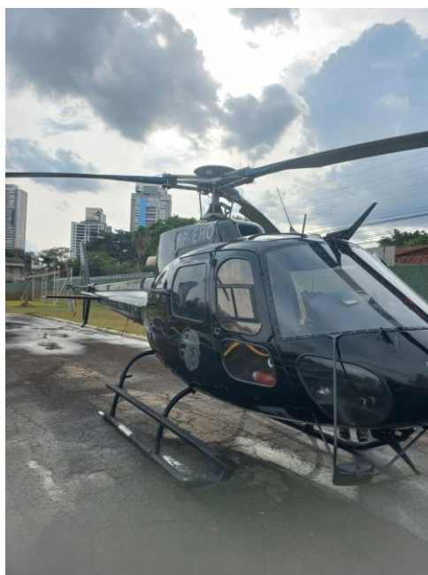
Figura 2 - Helicóptero GRAer HB 350B (Esquilo)

As equipes que são apoiadas pelo helicóptero revelam que o efeito do GRAer causa uma sensação da ocorrência estar resolvida com o apoio do céu. (POLICIAL N°2)