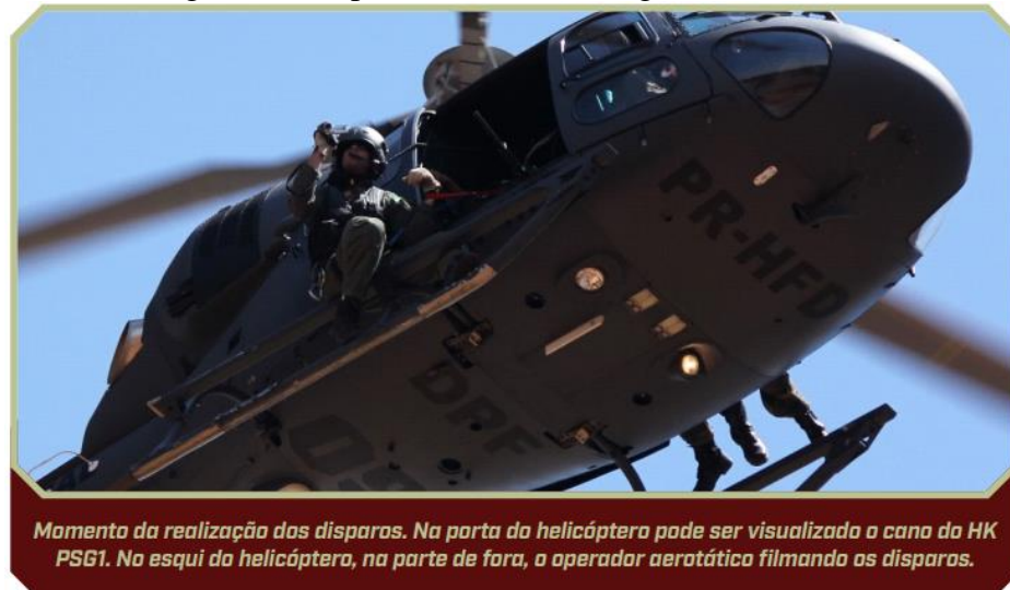
Figura 1 - Disparo de atirador designado aerotático