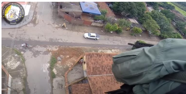
Figura 7 – Imagem de um atirador em ação

Os OATs necessitam de um tiro com maior precisão em alvos em movimentos, por exemplo, perseguição a veículos em deslocamento; seja um disparo em seu motor como também em seu pneu, para que este assim pare e a equipe possa proceder com a ocorrência. O curso seria um aprimoramento excelente para os operadores aerotáticos, tendo em vista que já se mostrou eficaz em ocorrências do GRAer, mesmo sem curso específico algum, o qual pode vir para somar e melhorar ainda mais a eficiência no combate ao crime, como as imagens abaixo: