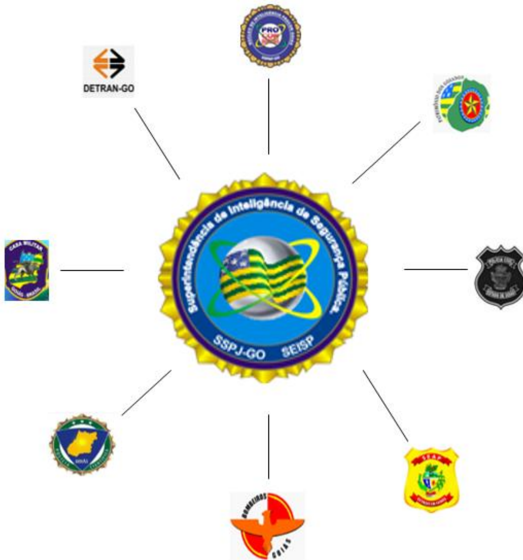
Figura 01- organograma

(Gerência de Inteligência Penitenciária); Superintendência de Polícia Técnica-Científica (SPTC ); Gerência de Inteligência da Secretária de Estado da Casa Militar; Departamento Estadual de Trânsito (DETRAN-GO); Superintendência de Proteção aos Direitos do Consumidor PROCON/GO, na seguinte disposição: