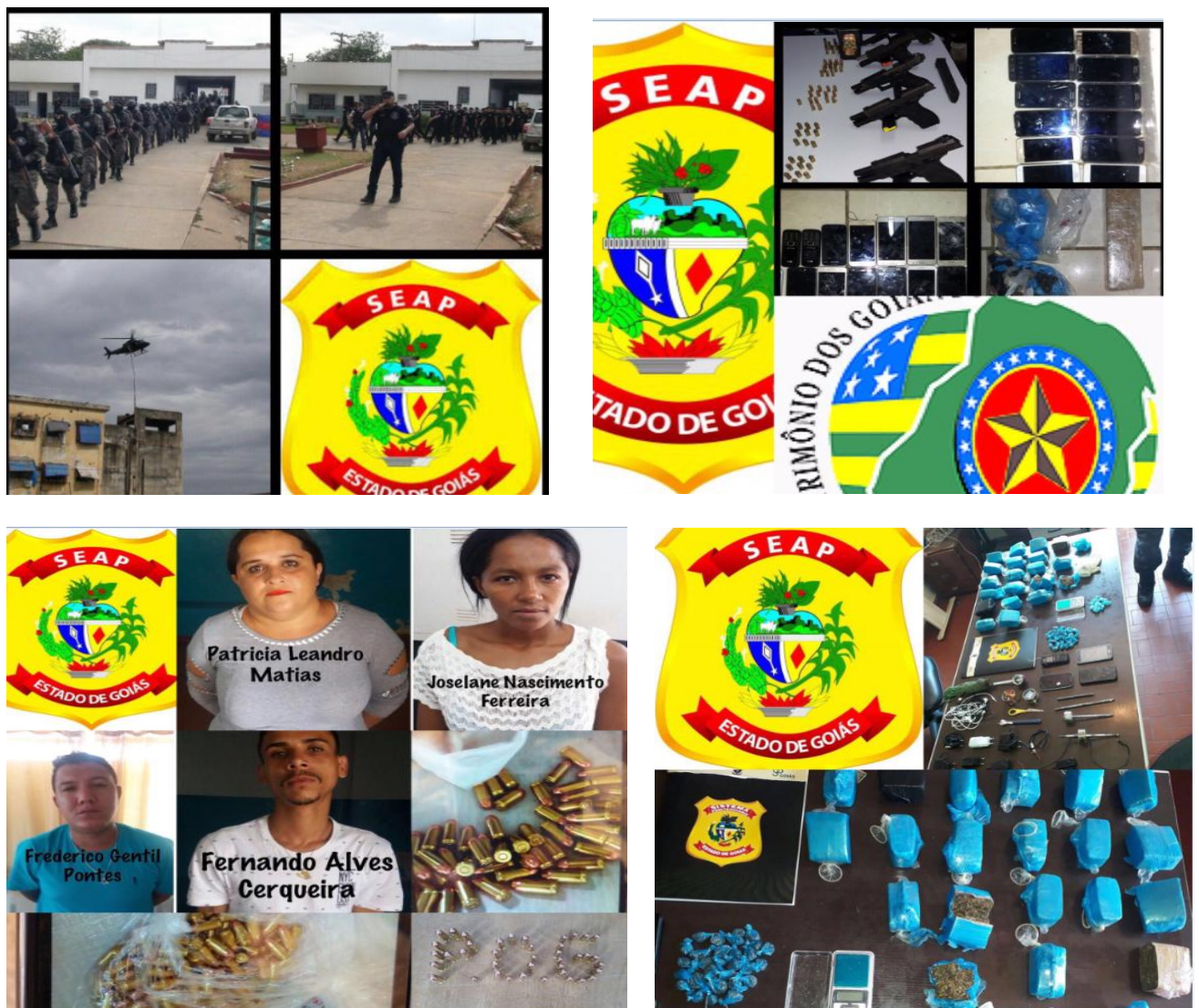
Figura 03 – Fotos

Mais como a Inteligência Penitenciária, vai evitar que cenas como estas, se repitam no cotidiano do Sistema: