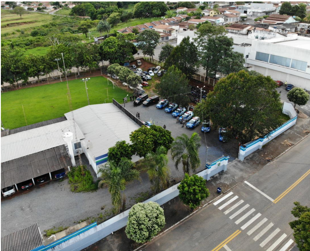
Figura 8 - 48º Batalhão de Polícia Militar do Estado de Goiás