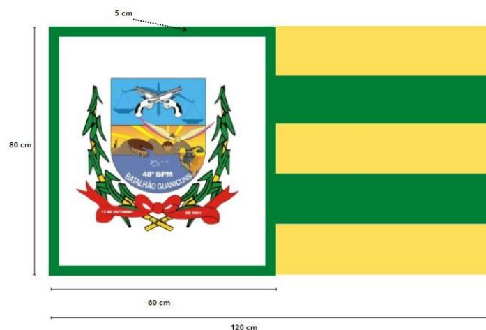
Figura 4 – Insígnia do Comandante do 48º BPM

Com relação à Insígnia do Comandante do 48º Batalhão de Polícia Militar, esta deve ser retangular, no tipo de bandeira universal, com tamanho de 80cm x 120cm, dividida em dois campos de 60cm cada. O primeiro campo é constituído por uma bordadura na cor verde sobre fundo branco, com o Brasão de Armas do batalhão ao centro. Já o segundo campo é de fundo amarelo, com duas faixas verdes, indicativas do posto de Tenente-Coronel QOPM, Comandante de Batalhão.