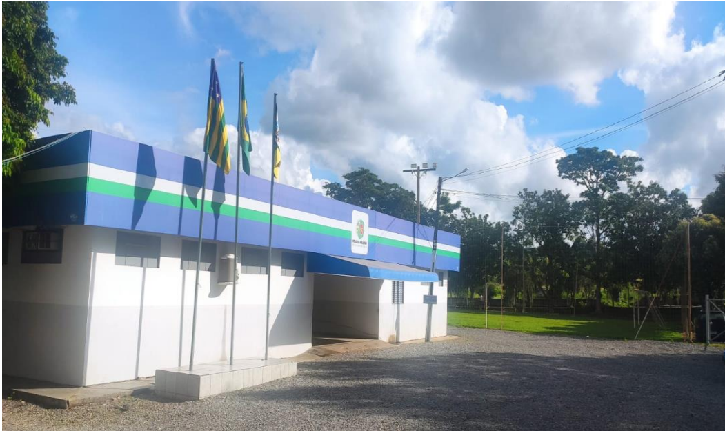
Figura 7 - 48º Batalhão de Polícia Militar do Estado de Goiás