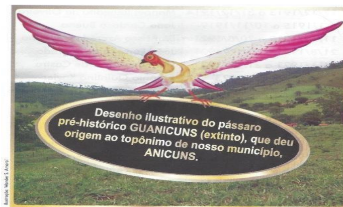
Figura 1 – Imagem ilustrativa do pássaro Guanicuns