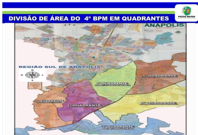
Figura 5. Divisão de quadrantes