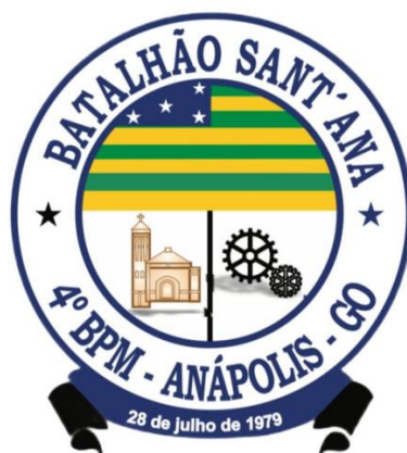
Figura 1: Brasão da Unidade