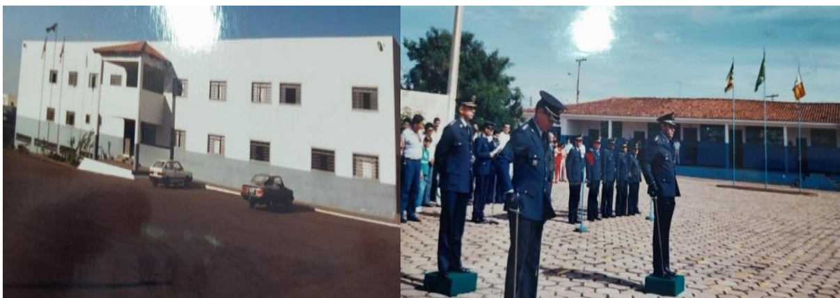
Figura 2: Antiga fachada da Unidade em Anápolis - GO