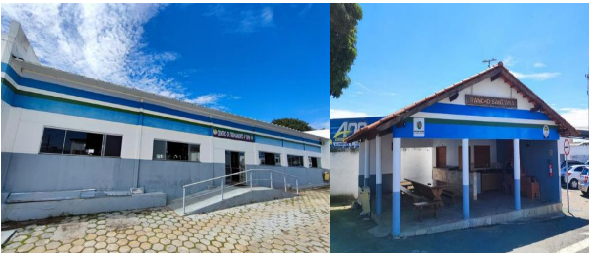
Figura 3: Atual fachada da Unidade e o Rancho.