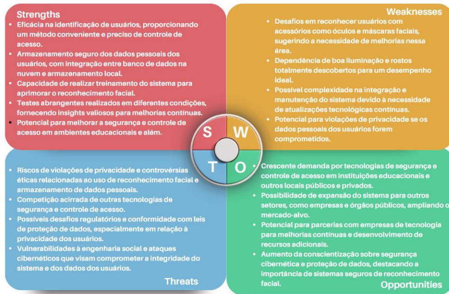
Figura 1 Análise Swot sobre a implementação do projeto de reconhecimento facial