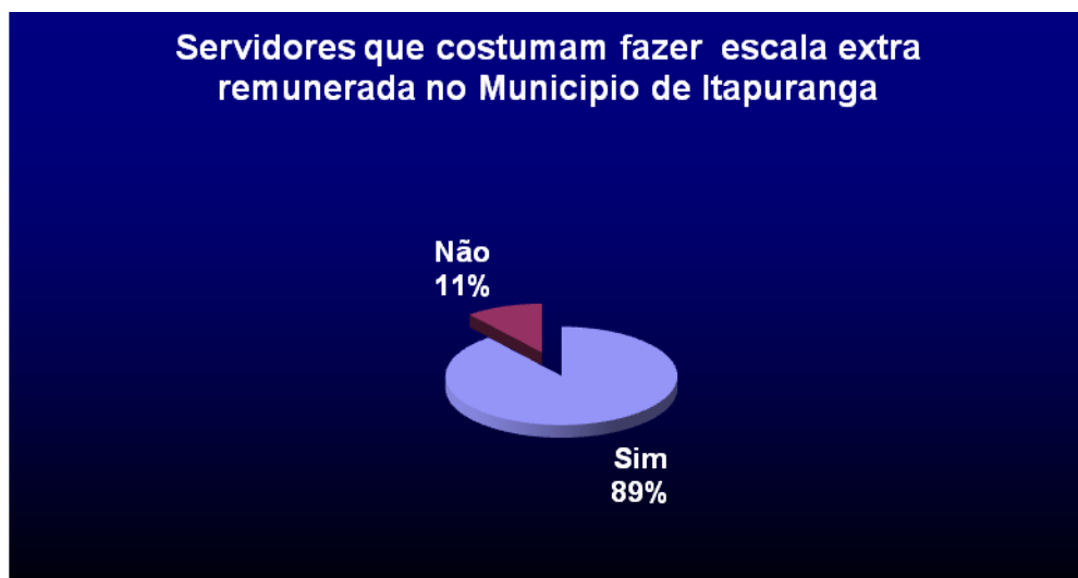
Gráfico 2: Serviço extra remunerado (AC4).

Quando questionados aos pesquisados, se faziam AC4, o resultado foi a maioria, em ambos turnos, conforme o gráfico 2, o desgaste do trabalho nas horas de folga pode ser um dos fatores que contribuem para o surgimento de várias doenças mentais., no entanto caso houvesse melhores condições de trabalho para os policiais militares de Goiás, com uma remuneração, justa não haveria a necessidade deste se submeter a excesso de cargas de trabalho no serviço extra-remunerado.