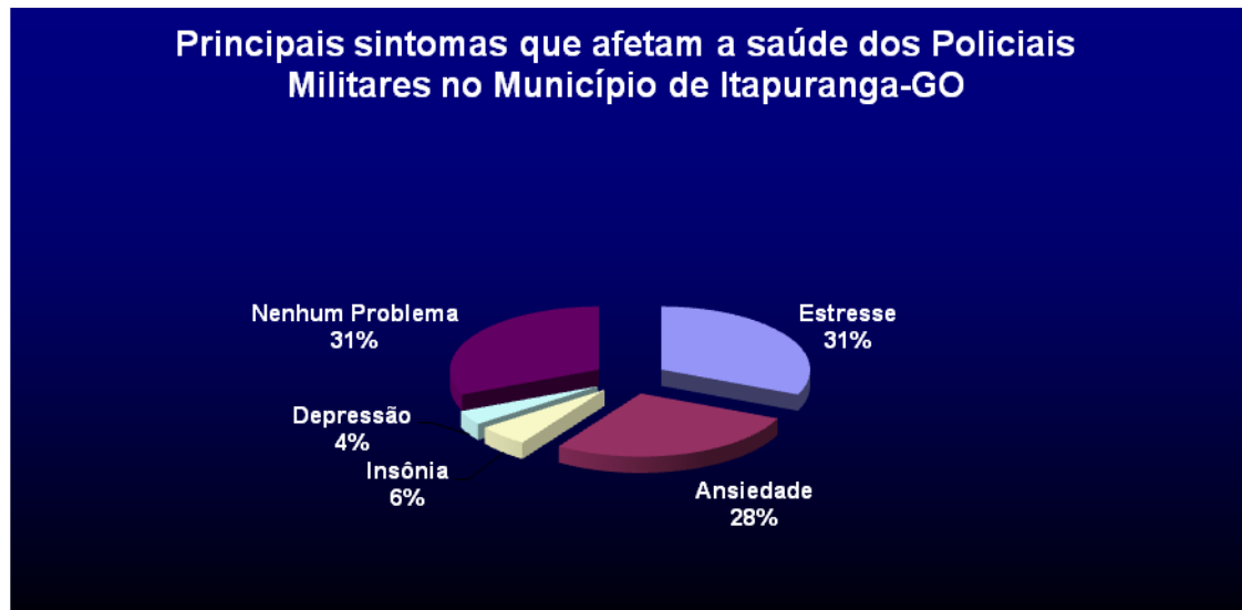
Gráfico 3: Sintomas desencadeados durante a profissão.

sintoma desencadeado durante a profissão, o resultado apontou o estresse, ansiedade, insônia e depressão.