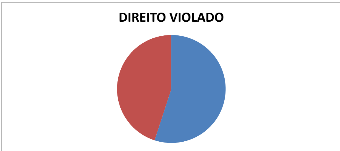
GRÁFICO 03: N110 Você já teve durante a carreira algum direito violado?

Os policiais militares de Valparaíso, não tem boa percepção sobre efetividade da comissão de direitos humanos é o que se ficou claro na pergunta sobre se já teve algum direito violado, onde a grande maioria respondeu que sim.