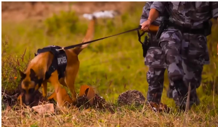
Foto 3: Chacal utilizando a técnica de rastreio durante a Operação Lázaro.

Rastreio: o cão trabalha com o focinho colado ao solo, analisando os dados olfativos presente nas diversas substâncias que compõem aquele local. O cão se atém aos dados circunstanciais e adicionais;