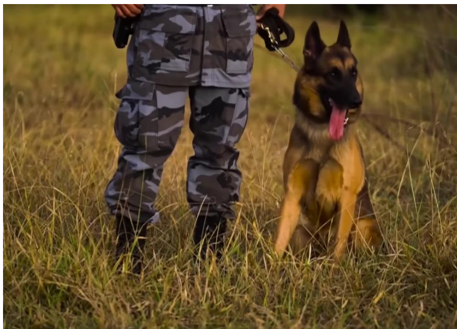
Foto 4: Cão Saukê sentado após realizar a técnica de venteio durante Operação Lázaro.

Venteio: o cão trabalha com o focinho suspenso colhendo dados olfativos no ar. Neste caso, o cão utiliza a memória de odores que possui para procurar e identificar cheiros familiares no ambiente misturados a outros ali presentes. Quando faz uso desta técnica, movimenta-se de maneira desconexa em todos os sentidos, cheios de curvas e retornos. (SIQUEIRA; NICÁCIO, 2010, p. 49).