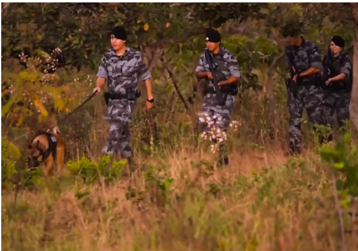
Foto 1: Equipe BPCÃES e cão Chacal realizando a técnica do rastreio na Operação Lázaro.