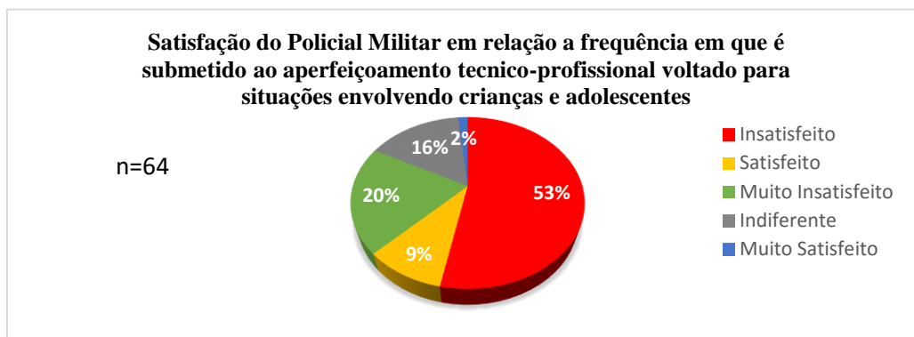
Gráfico 1: Satisfação dos PMs em relação à frequência do aprimoramento técnico-profissional

Por conseguinte, ao analisar os dados referente à frequência em que o policial militar é submetido ao aprimoramento técnico-profissional envolvendo crianças e adolescentes, é possível verificar os seguintes resultados: 20% estão muito insatisfeitos, 53% estão insatisfeitos, 16% sentem-se indiferente, 9% estão satisfeitos e 2% estão muito satisfeitos conforme demonstrado no gráfico que segue: