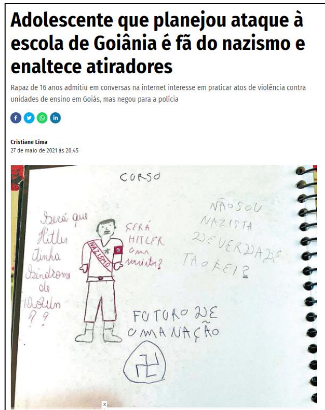
Figura 2 – Site: Jornal o Popular.

realizar ataques a escolas em Goiás. O adolescente manteve vários perfis em diversas redes sociais e usa esses canais para conversar com outras pessoas que compartilham os mesmos interesses (O POPULAR, 2021).