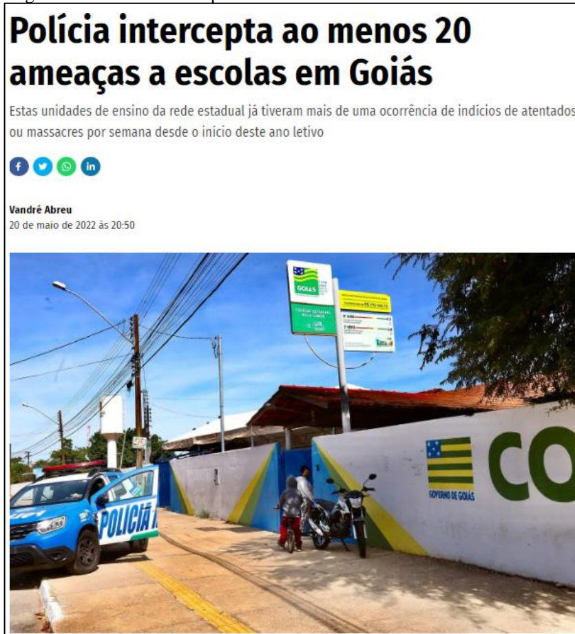
Figura 3 – Site: Jornal o Popular.