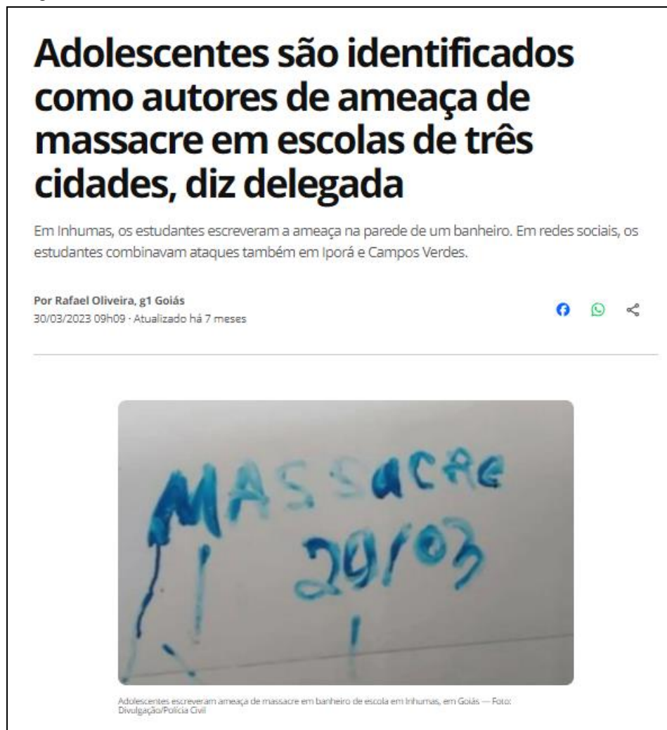
Figura 5 – Site: G1

Observamos, na figura 5, que adolescentes foram identificados como autores de um massacre declarado em uma escola no estado de Goiás. O primeiro adolescente foi identificado em uma escola pública de Inhumas, onde estudantes escreviam ameaças nas paredes dos banheiros. Segundo o alerta, o massacre ocorreria no dia 29 de março de 2023, mas foi impedido pela polícia. O aluno de Inhumas tem 13 anos e está na oitava série. Logo após a notícia do massacre, a polícia começou a monitorar as redes sociais do estudante (G1, GOIÁS, 2023).