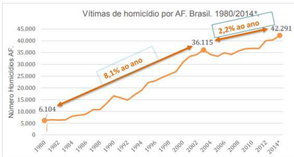
Figura 2 – Vítimas de homicídio por Armas de Fogo entre 1980 e 2014.