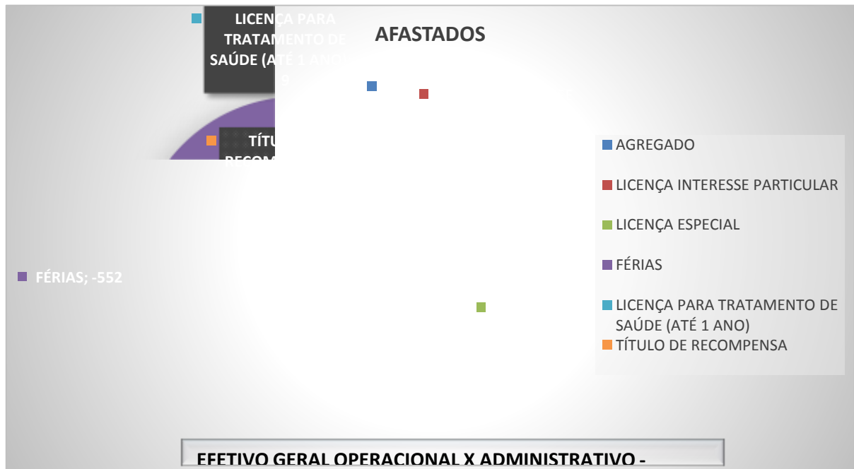
Gráfico 2 – Estratificação das causas de afastamento dos Policiais Militares do Estado de Goiás