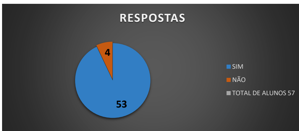
Gráfico 1 – O projeto polícia mirim de alguma forma influenciou no seu comportamento e tratamento para com as outras pessoas?