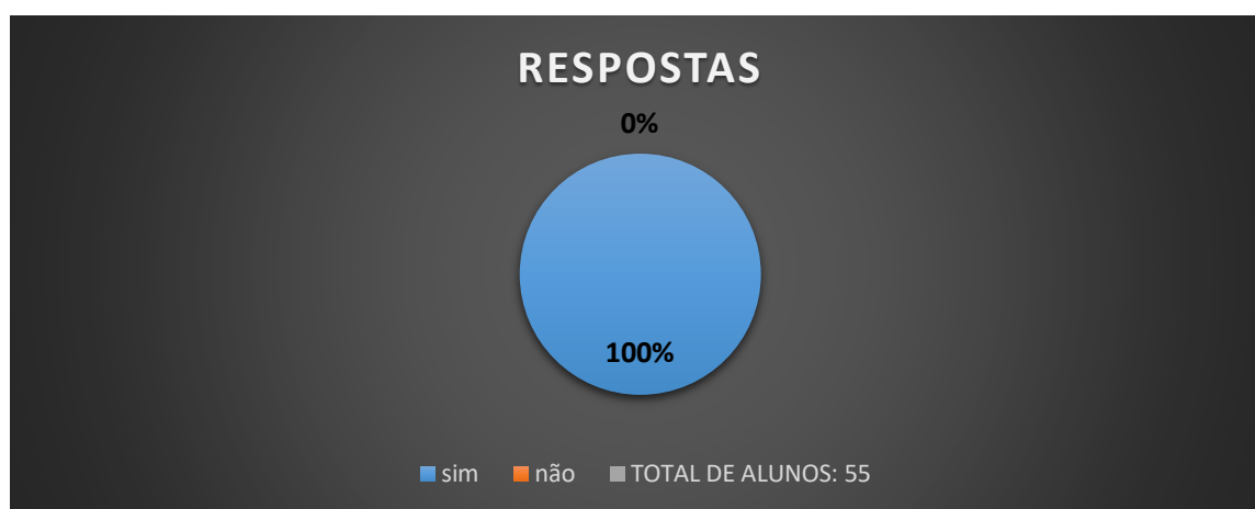
Gráfico 2 – A polícia militar tem contribuído com o seu desenvolvimento escolar?

O gráfico 1 demonstra uma significativa melhora no comportamento dos alunos no projeto sendo que dos 57 entrevistados, 53 responderam que sim, correspondendo a 93% das crianças e adolescentes e somente 4 o que representa 7% demonstrou não adequação e melhoras frente ao projeto.