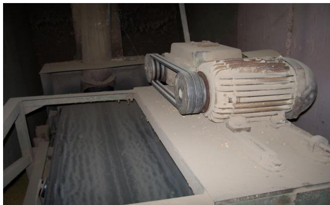
Figura 3 – Pó de grãos em repouso sobre o maquinário

A explosão de pó de grãos é a combustão ou queima instantânea de pequenas partículas em um espaço fechado, que resulta em súbito aumento da pressão, com transformação de energia térmica e expansão de gases aquecidos.