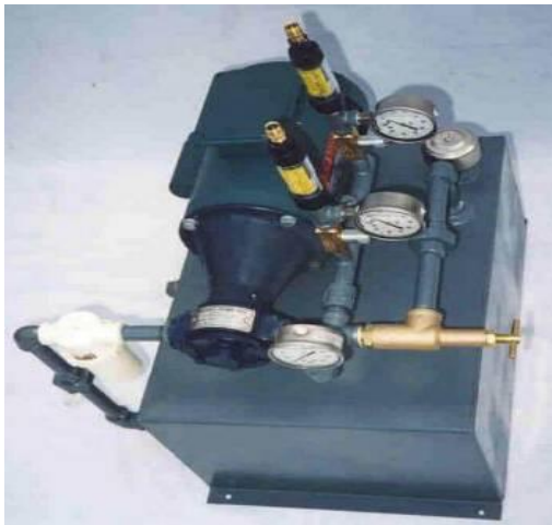
Figura 9 - aspersor de óleo mineral

Outra medida utilizada são instalações de unidades portáteis de pulverização de óleo mineral, que consiste em umedecer a massa de grãos de forma que evitem a formação de partículas, utilizando-se o aspersor da figura 9.