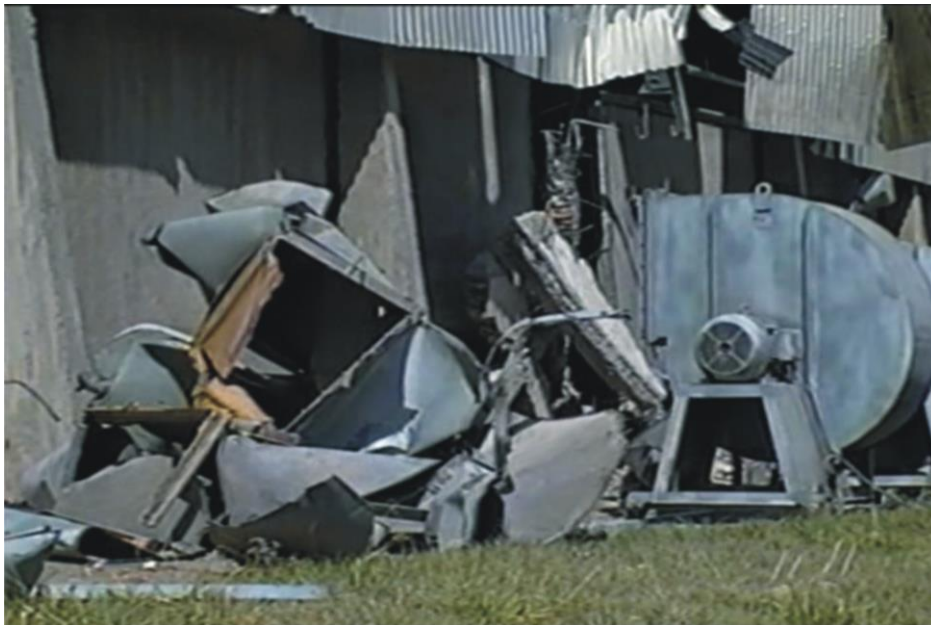
Figura10 - Equipamentos destruídos por explosão – Rio Verde-Go

São comuns, nestes acidentes, a destruição total ou parcial dos maquinários e equipamentos (figura 10), a reação se processa com extrema violência retorcendo barras de ferro, danificando paredes de concreto, telhado, comprometendo toda edificação e principalmente, ceifando vidas dos trabalhadores.