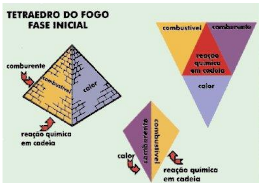
Figura 2 – Tetraedro do fogo