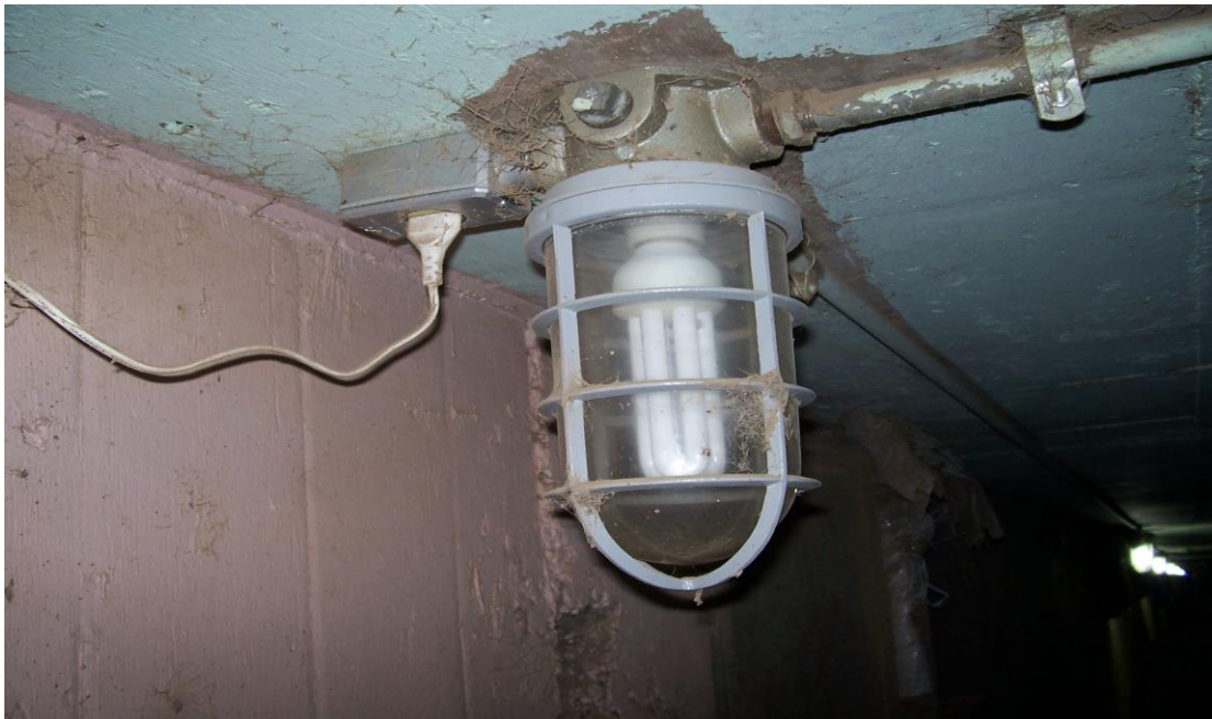
Figura 6 - No interior dos túneis, as luminárias são protegidas por uma redoma de vidro, evitando que o calor produzido, nos casos de queima das lâmpadas atinja a nuvem de pó.

A temperatura mínima de inflamabilidade é a temperatura necessária para por em ignição uma nuvem de pó, situa-se entre 300 e 600 ° C, o que confere a quantidade de energia referente às potencias entre 10 e 40 milijoules 5 , o que é produzido durante a queima de uma lâmpada, por exemplo, conforme demonstra a figura 6.