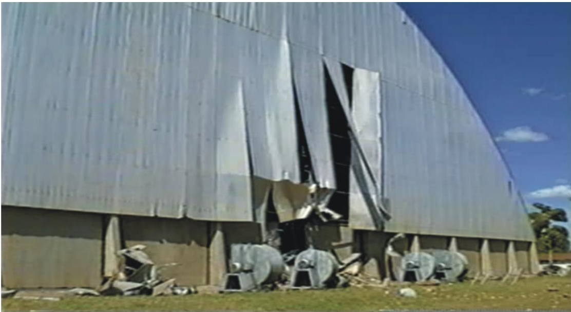
Figura 7 - Parede do silo destruída em virtude da explosão ocorrida – Rio Verde-GO

O teor de umidade do pó mais susceptível a provocar um acidente com explosão está em torno de 6%, o que geralmente corresponde a umidade de equilíbrio do pó em um ambiente com 50% de umidade relativa do ar.