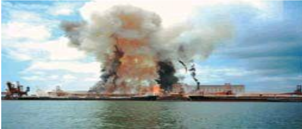
Figura 5 – Explosão no Porto de Paranaguá - (2002). Terminal da Coimbra - 13 feridos

7.000 metros por segundo e exercer pressão de vários Kilo Pascal 3 ; quanto à violência e potência da explosão são quantificadas em função da velocidade da detonação, da temperatura e do volume dos gases produzidos.