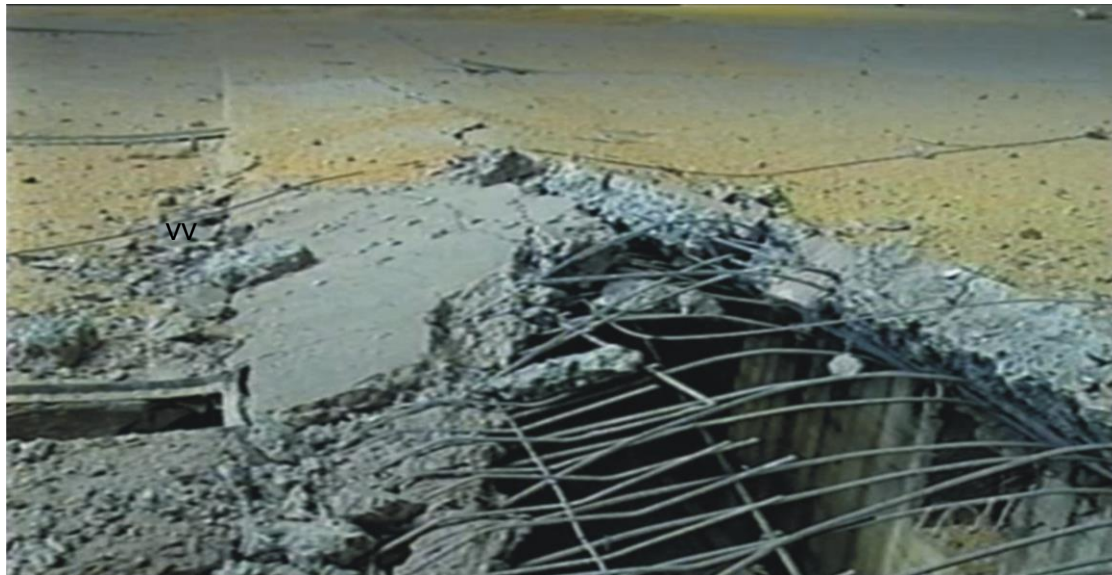
Figura 4 – Dano causado em uma unidade armazenadora em Rio Verde - Go. Estrutura de concreto armado construída para suportar dezenas de toneladas, de massa de grãos, completamente destruída.