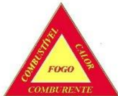
Figura 1 – Triângulo do fogo