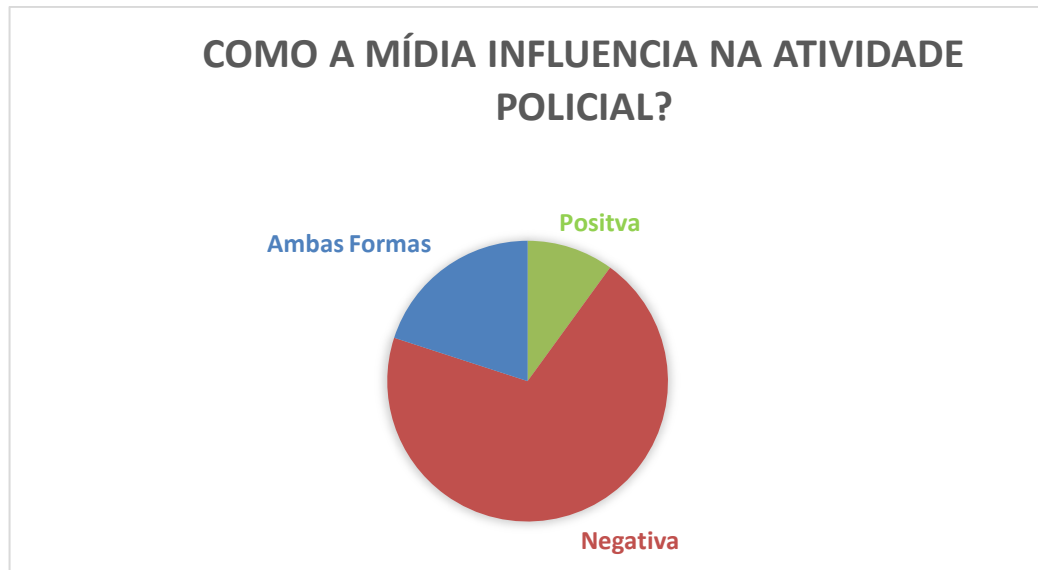
Gráfico 1: Como a mídia influencia na atividade policial?

Com as respostas obtidas, alguns dados foram compilados em gráficos para que fosse possível obter informações relevantes que corroborassem a pesquisa. A seguir, o Gráfico 1 aponta o resultado da primeira pergunta do questionário.