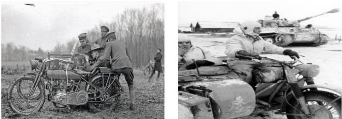
Figura 1: Utilização de motocicletas na 1º e 2º guerra mundial

Durante o século XX, as motocicletas também desenvolveram sua função como veículos de apoio às operações militares, com registros que remontam à Primeira Guerra Mundial. O uso de motocicletas na guerra expandiu seu uso do simples transporte para tarefas especializadas, como vigilância e patrulhamento. A unidade de elite do Exército dos EUA, conhecida como “Rangers”, usava motocicletas para patrulha, reconhecimento e assalto. Os SEALs de elite da Marinha dos EUA usam o veículo para embarcar e pousar aeronaves durante missões de assalto. Como mostra a figura 1 a seguir.