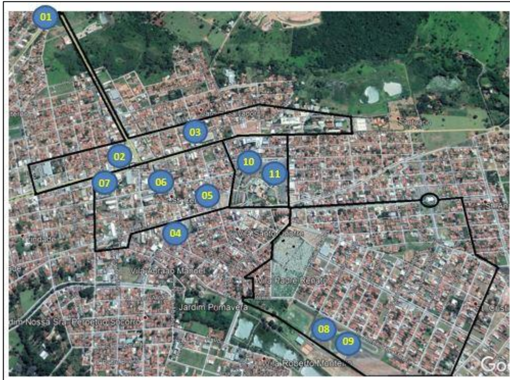
Figura 2 – Locais das Bases fixas de policiamento.

elevadas, com o fito de analisar a aplicação dessa estratégia de divisão e constatar a sua aplicação nos locais de maior aglomeração.