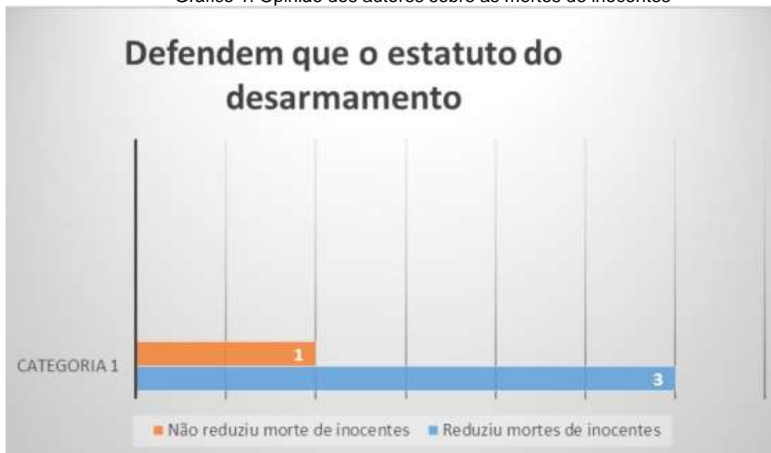
Gráfico 1: Opinião dos autores sobre as mortes de inocentes

O gráfico a seguir mostra a opinião dos autores consultados sobre a prerrogativa que o ED reduziu a morte de pessoas inocentes, ou seja, mortes por motivos banais;