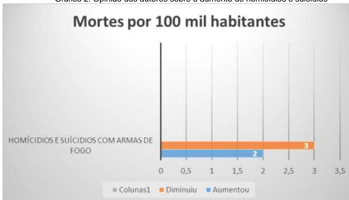
Gráfico 2: Opinião dos autores sobre o aumento de homicídios e suicídios

O gráfico a seguir mostra qual a opinião dos autores em relação ao aumento do número de mortes por 100 mil habitantes no Brasil, se estas mortes aumentaram de forma significativa ou se foram reduzidas. O gráfico leva em consideração também os suicídios;