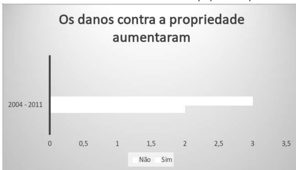
Gráfico 3: Os danos contra a propriedade após o ED

O gráfico a seguir trata do aumento de danos contra a propriedade, este é um dos itens pouco debatidos e que também partem do pressuposto da investigação. Alguns pesquisadores do tema chegam a afirmar que não há qualquer dado pertinente sobre a questão do aumento desses danos contra a propriedade.