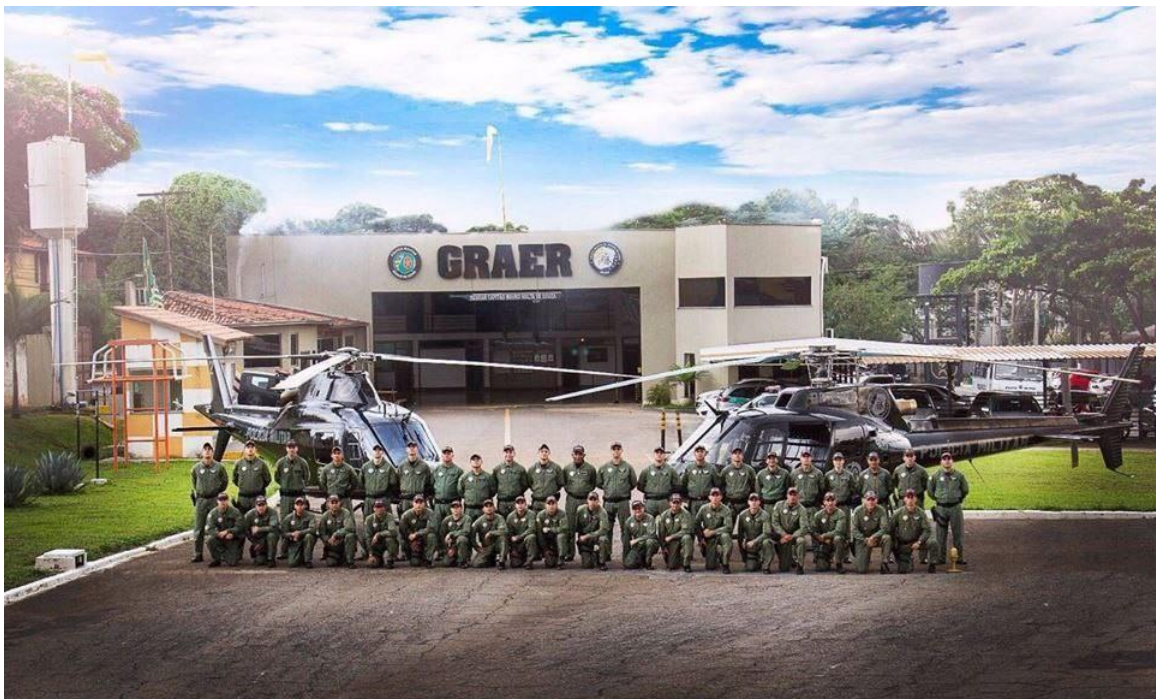
Figura 4 – Imagem panorâmica da unidade