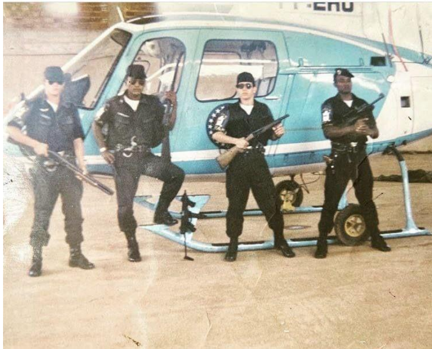
Figuras 3,4 – Fardamento antigo e atual