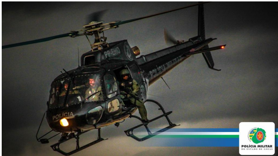
Figura 2 – Atual identidade visual da aeronave

A unidade foi se reformulando com o passar dos anos e a necessidade de evolução, o galpão foi completamente reformado, trocado piso, novas salas foram construídas e outras reformadas, alojamentos maiores. Referente a equipamentos o GRAER sempre atuou com equipamentos bons. Sobre aeronaves, desde a criação temos uma aeronave que veio do SAEG, tempos depois tivemos uma aeronave que foi leiloadada; por volta de 2005 o governo alugou helicópteros. Atualmente nós temos duas aeronaves uma em operação e outra com defeito que está em conserto (ENTREVISTADO 03).