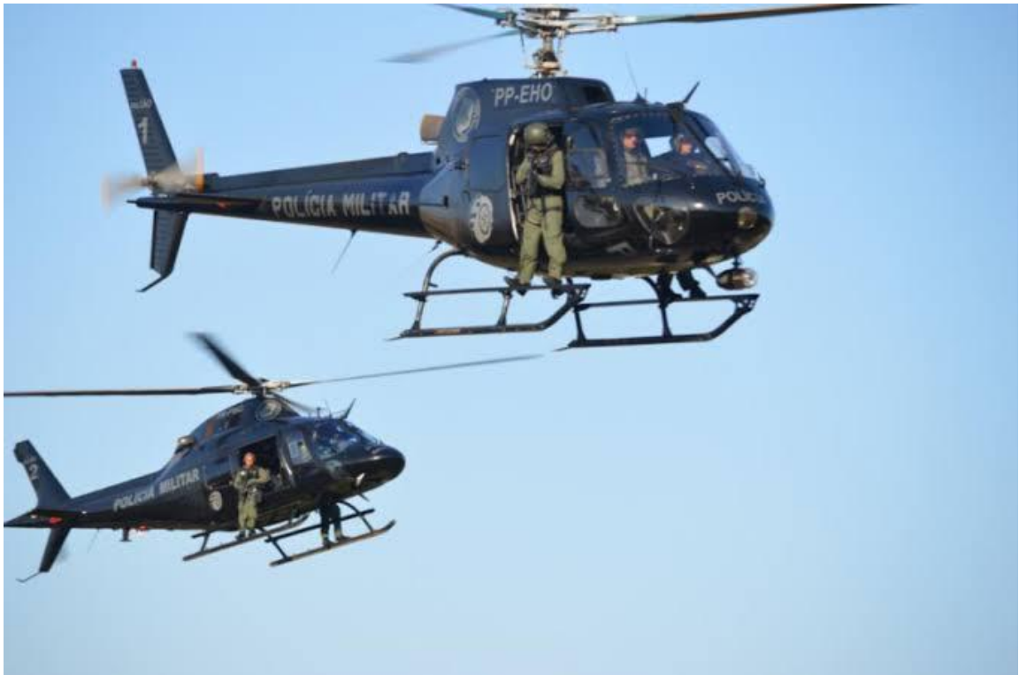
Figura 5 – Aeronaves do GRAer