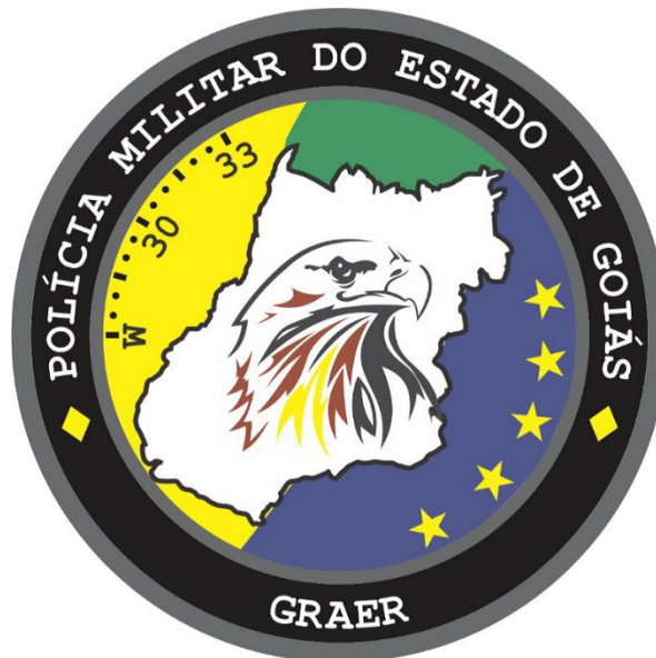
Figura 2 – Brasão do GRAer