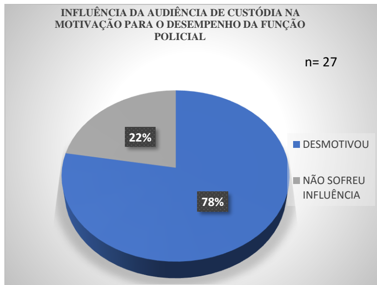
Gráfico 2: Influência da audiência de custódia na motivação profissional.

Um dos reflexos da audiência de custódia que se busca levantar com o presente artigo, é a influência, desta, na motivação dos policiais militares do batalhão ao desempenharem suas funções, pois implica diretamente na forma como o serviço está sendo prestado à sociedade e a atenção que a Polícia Militar precisa dar ao recurso humano sob sua administração. Portanto ao serem questionados sobre essa influência, um dos pontos mais importantes da pesquisa, obteve-se o seguinte resultado: