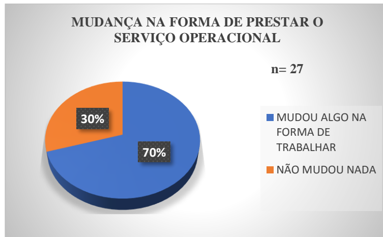
Gráfico 4: Mudança na forma de prestar o serviço operacional