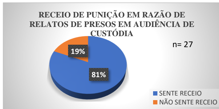
Gráfico 3: Receio de punição por relatos de presos em audiência de custódia.

Sendo assim questionou-se à tropa operacional do 30º BPM se sentem receio de punições judiciais e/ou administrativas por conta das alegações da pessoa presa em flagrante. Mais de 80% dos policiais alegam sentir sim o receio de punições. A saber: