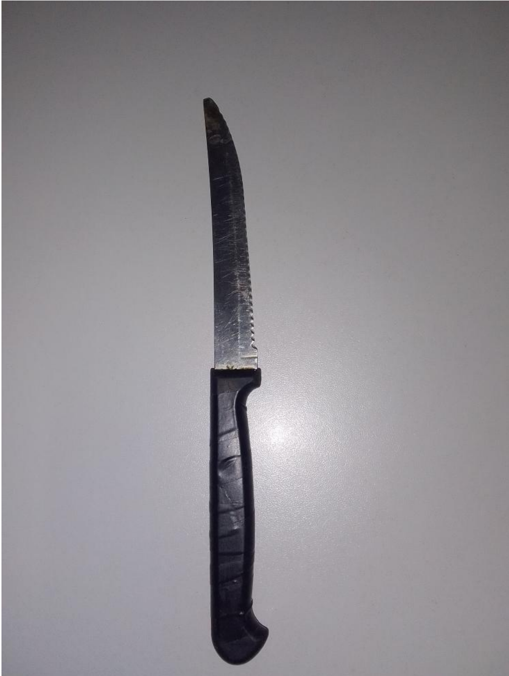
Imagem: 165065385988078188849 34391442414.jpg