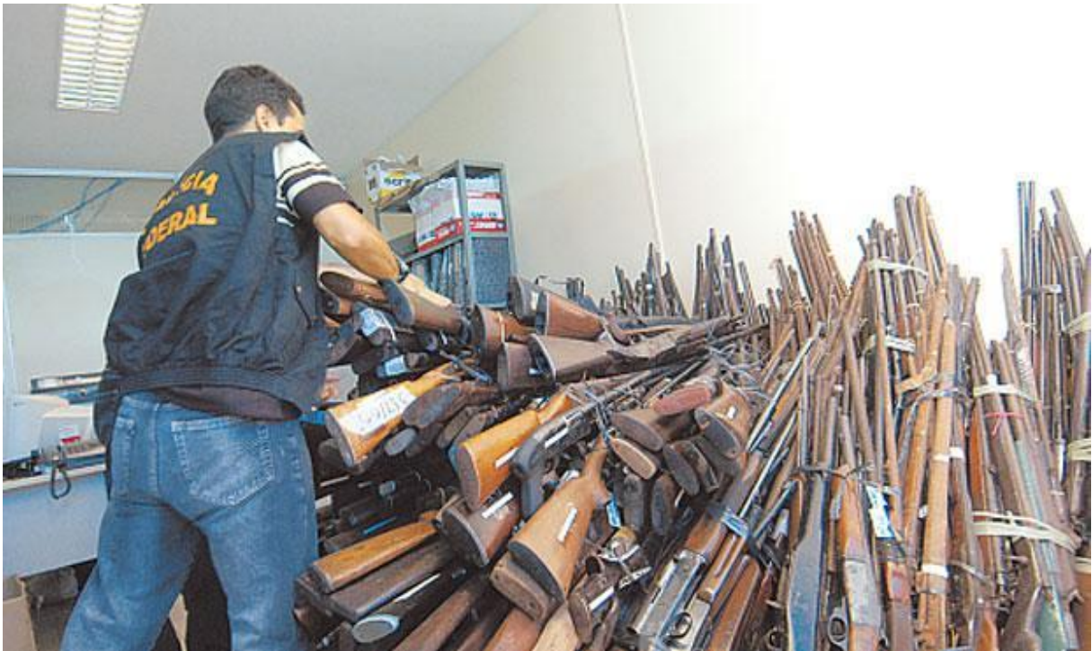
Imagem 3.2.I – Armas entregue a Polícia Federal na campanha do Desarmamento