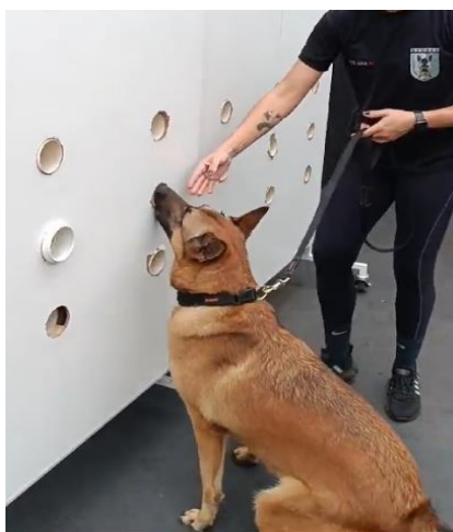
(Método de treinamento no Painel de Faro)