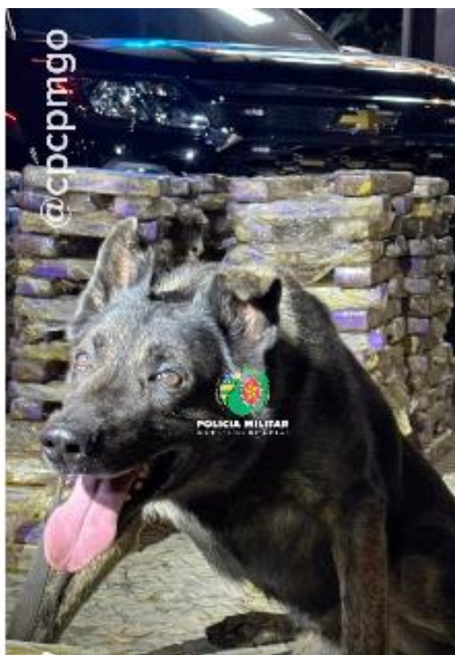
(Cão Iron em apoio a CPE de Aparecida que acarretou na apreensão de 1 tonelada de drogas)

7. "Em apoio à Polícia Civil de São Simão, ao adentrar a casa de um traficante durante a busca policial, nenhum ilícito foi encontrado. Ao aplicar o cão para conferência em situação de droga enterrada, a cadela Isis (Labrador) puxou o condutor até o muro e sinalizou para o outro lote. Saímos desse lote e reaplicamos no local indicado pelo cão. A cadela levou a equipe até o final desta residência, onde se encontrava 1 kg de maconha que havia sido jogado pelo traficante ao perceber a chegada da polícia. Isso representou a primeira prova de rastro de odor no ar indicado pelo cão e garantiu a prisão do autor imediatamente. Em outra situação, acionados pela CPE de Aparecida de Goiânia, onde já haviam abordado um caminhão com cerca de 130 kg de maconha, ao trazer para a Polícia Federal de Goiânia, solicitou-se apoio dos cães. Ao utilizar o cão Iron (Pastor Holandês), este marcou na parte de baixo da carroceria. Toda a equipe se empenhou em localizar algo ilícito. Diante da marcação clara do cão, acionamos os bombeiros com maquinário de desencarceramento, e dentro da estrutura metálica foram encontrados mais 880 kg de maconha, totalizando uma tonelada de drogas."