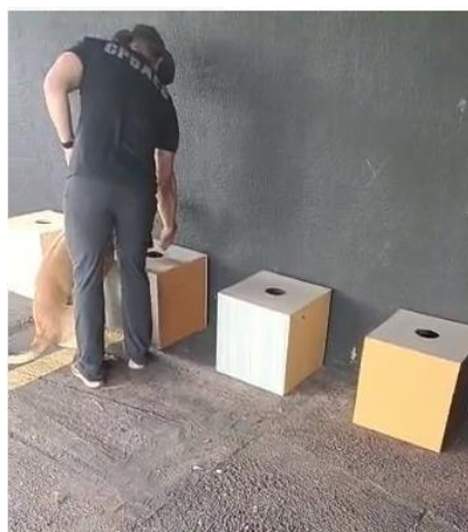
(Método de treinamento com caixas)