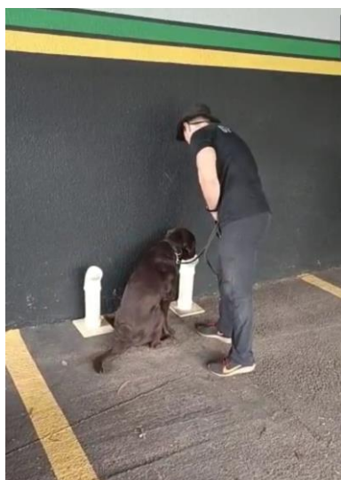
(Método de treinamento em tubo de PVC)