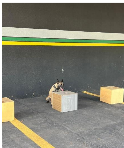
(Método de treinamento com caixas)