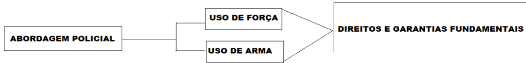
Figura 1 - Da abordagem policial e as garantias constitucionais