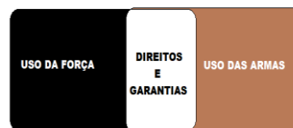
Figura 2 - Dos Direitos e as Garantias Fundamentais

Dessa maneira, com base nos pressupostos abordados assim pode ser representado figurativamente a relação entre a força e as armas com relação aos direitos humanos: