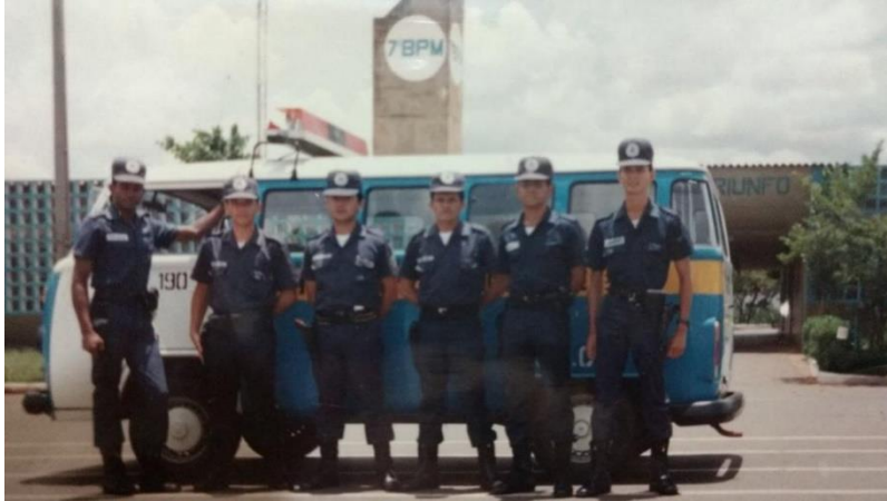
Figura 4. Policiais em frente ao 7º Batalhão.