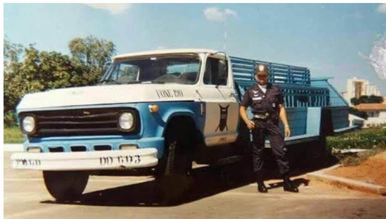
Figura 5. Policial com viatura da época.