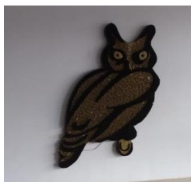
Figura 6. Símbolo do Batalhão Triunfo