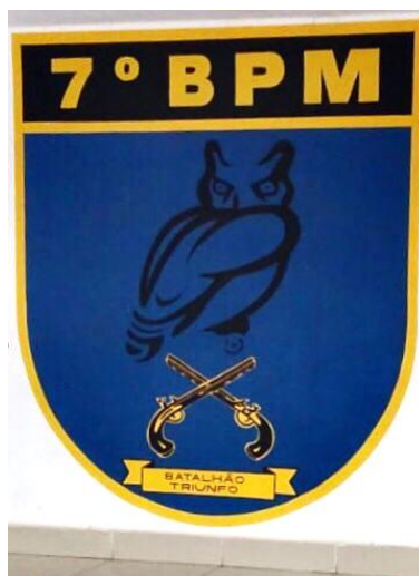
Figura 3. Brasão exposto em pintura no saguão do Batalhão Triunfo.

Quanto à estrutura do Batalhão Triunfo, foi possível verificar as seguintes mudanças: outrora, o 7º Batalhão de Polícia Militar também funcionava como unidade escola, mas em 1995, após a conclusão do último Curso de Formação de Praças, o batalhão deixou de exercer tal função. Outro sim, também merece destaque a desativação do Centro de Internação Provisória que abrigava menores infratores. Porém, mesmo em face a tais desativações, a unidade passou por diversas reformas, construindo garagens que abrigam todas as suas viaturas, equipamentos e veículos de seu efetivo, auditório que abriga cerca de 100 pessoas e por fim, modernizando as suas instalações.