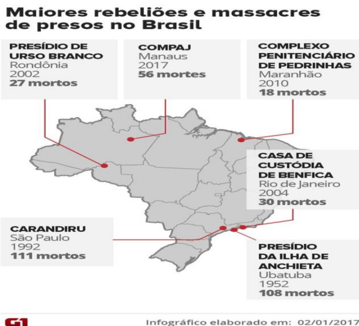
Gráfico 3: Rebeliões no Brasil