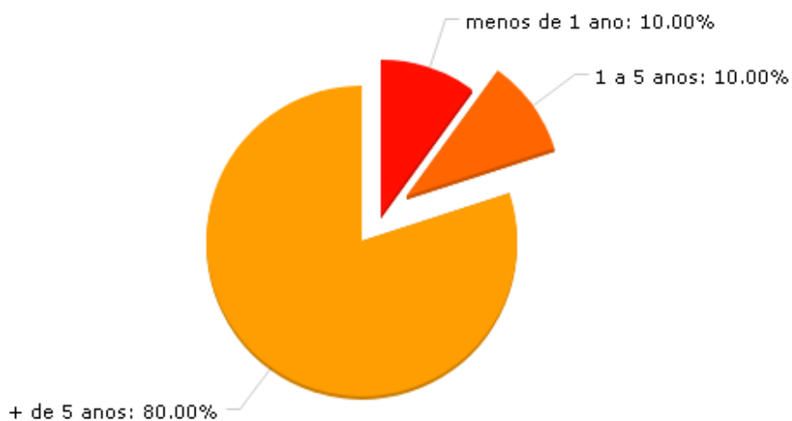
Gráfico 2. Tempo de Vinculo com a Polícia Militar