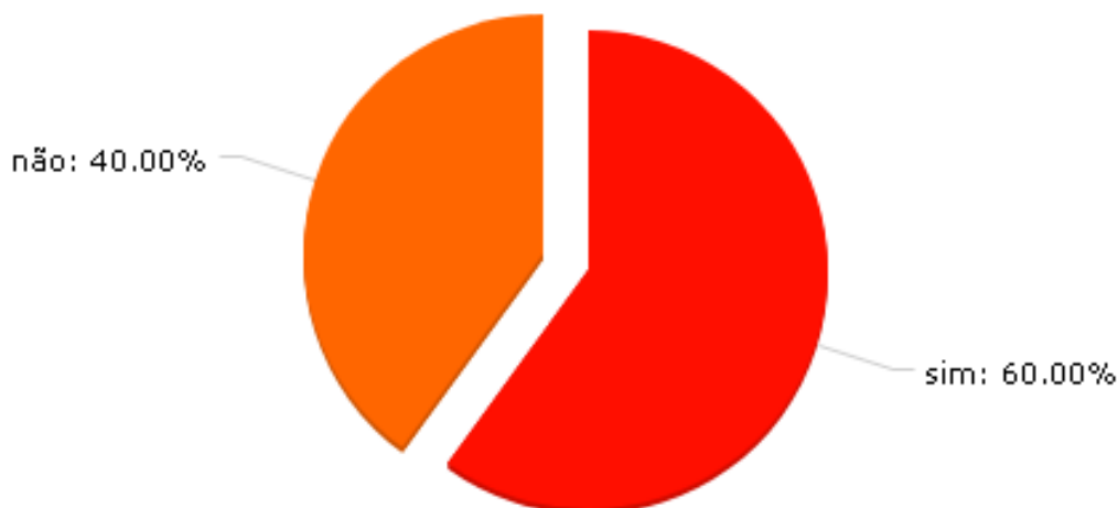
Gráfico 4. Costuma ler artigo extraclasse sobre o ensino e a formação do policial militar?

Podemos observar que 60% dos entrevistados costumam ler artigos em relação à formação dos profissionais, isso mantém eles sempre atualizados.