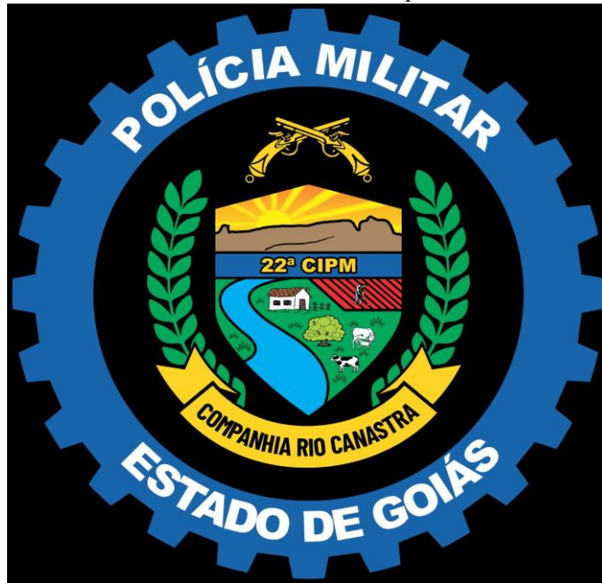
FIGURA 13: Brasão 22ª CIA Independente