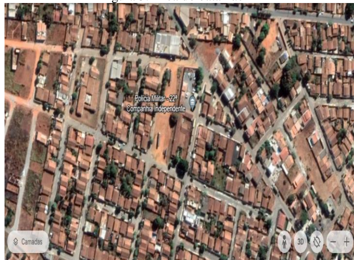
Figura 3: Área do batalhão