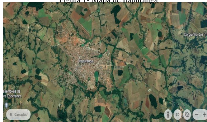
Figura 1- Mapa de Itapuranga

Em divisão territorial a atuação policial abarca além de Itapuranga, Guaraíta e Heitorai abarca outros 3 distritos: Lages, Cibele e Diolândia, senão vejamos: