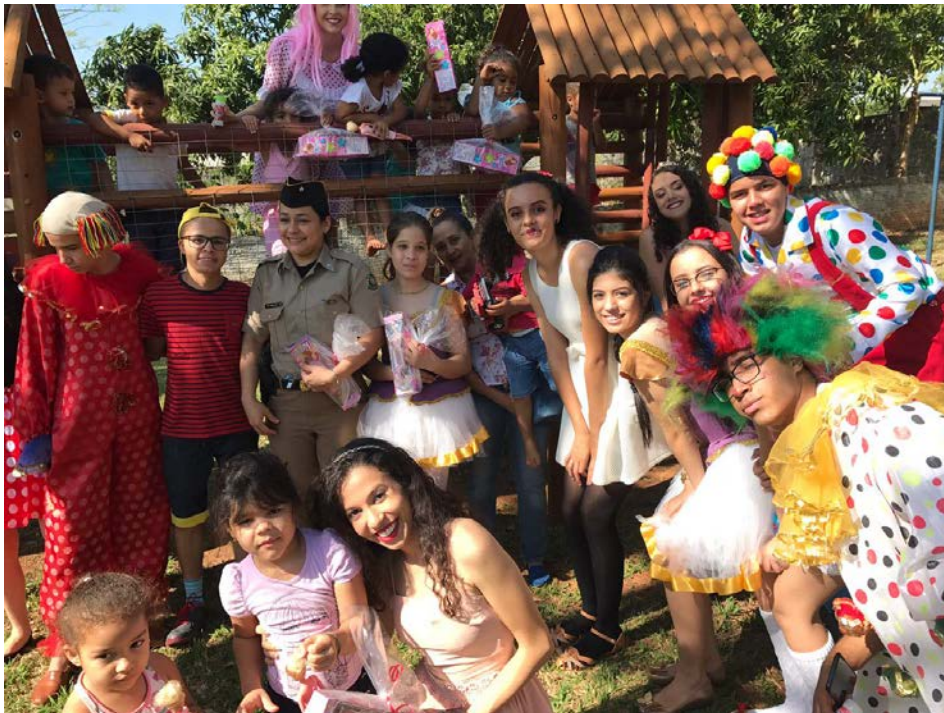
Figura 3 - Entrega de brinquedos na creche da ação “Sinceridade no sorriso” .

Fonte: Acervo do Projeto Agente Jovem no CEPMG-JC, 2017.