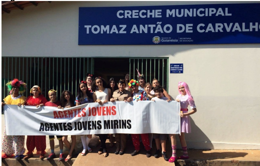
Figura 2 - Atividade “Sinceridade no sorriso”.