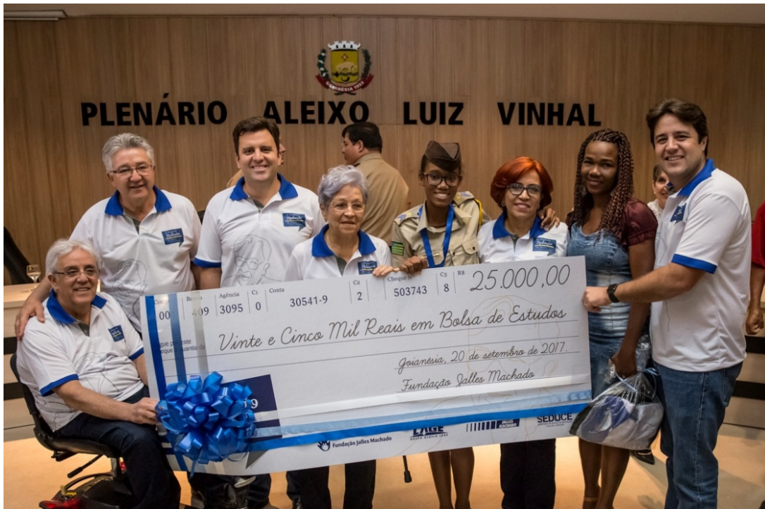
Figura 1 - Cerimônia de premiação da 11ª edição do Concurso de Redação Dr. Otávio.

Fonte: Acervo do Projeto Agente Jovem no CEPMG-JC, 2017.