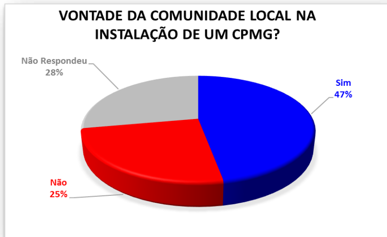
Gráfico 5 - Havia uma vontade da comunidade local (lideranças comunitárias, comerciantes, moradores e outros) na instalação de um CPMG?