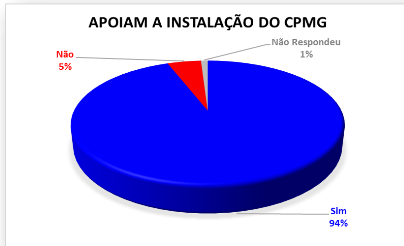
Gráfico 7 - Você apoia a Instalação do CPMG-MG?

92% assinalaram que sim, uma porcentagem alta, o que confirma a insegurança que viviam os moradores, comerciantes, professores antes do CPMG-MG. 7% assinalaram não e apenas 1% não responderam. Averigua-se que haviam problemas antes da instalação do CPMG.