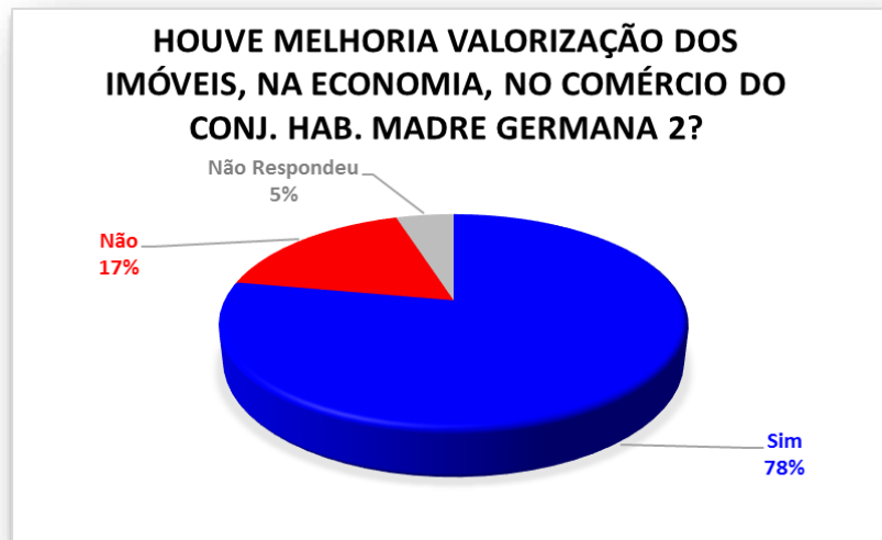
Gráfico 03 - Com a instalação do CPMG-MG houve melhoria valorização dos imóveis, na economia, no comércio do Conjunto Habitacional Madre Germana 2?