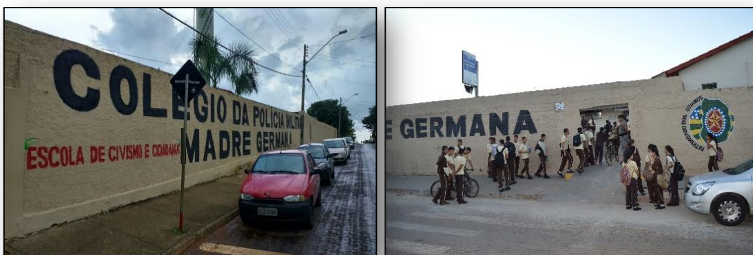
Figura 01 - Colégio da Polícia Militar de Goiás - Madre Germana

A quantidade de alunos matriculados e as suas frequências, conforme o Relatório de Quantitativo de Alunos (2017) fornecido pela Secretaria do CPMG-MG, no final de 2015, na transição do CEMAG/CPMG-MG, eram 1392 alunos matriculados e 1089 frequências. No final do ano de 2016 com o processo de transformação definitivo para o CPMG, haviam 1567 alunos matriculados e 1373 frequências. E até junho de 2017, estavam matriculados 1600 alunos e frequentavam 1528. Perfazendo uma diferença de 208 alunos a mais dos alunos matriculados, enquanto nas frequências o número é maior, a diferença é de 439 a mais, comparado aos anos de 2015 a 2017. O que demonstra um acréscimo considerável em ambos os aspectos.