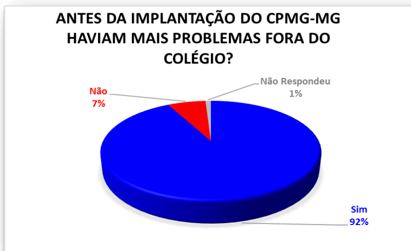
Gráfico 6 - Você acha que antes da implantação do CPMG-MG haviam mais problemas externos com alunos, fora do Colégio?

Dos entrevistados 47% responderam sim, verifica-se que havia interesse na instalação de um CPMG por parte da comunidade local, 25% responderam não e 28% não responderam à questão. Podemos salientar que a porcentagem de professores pode ter influenciado nesta porcentagem de 25%. E os 28% podemos analisar que a falta de conhecimento pode ter influenciado.