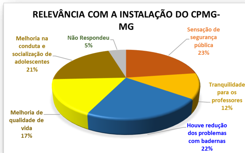
Gráfico 01 - Assinale os impactos de relevância com instalação do CPMG-MG:

A seguir os gráficos demonstram os dados e informações da importância da instalação do CPMG-MG.