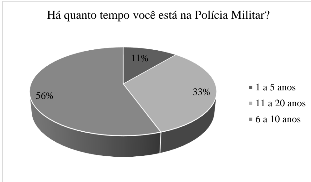
FIGURA 4 - Há quanto tempo você está na Polícia Militar?

Fonte: Dados coletados pelo autor pelo Google Forms .