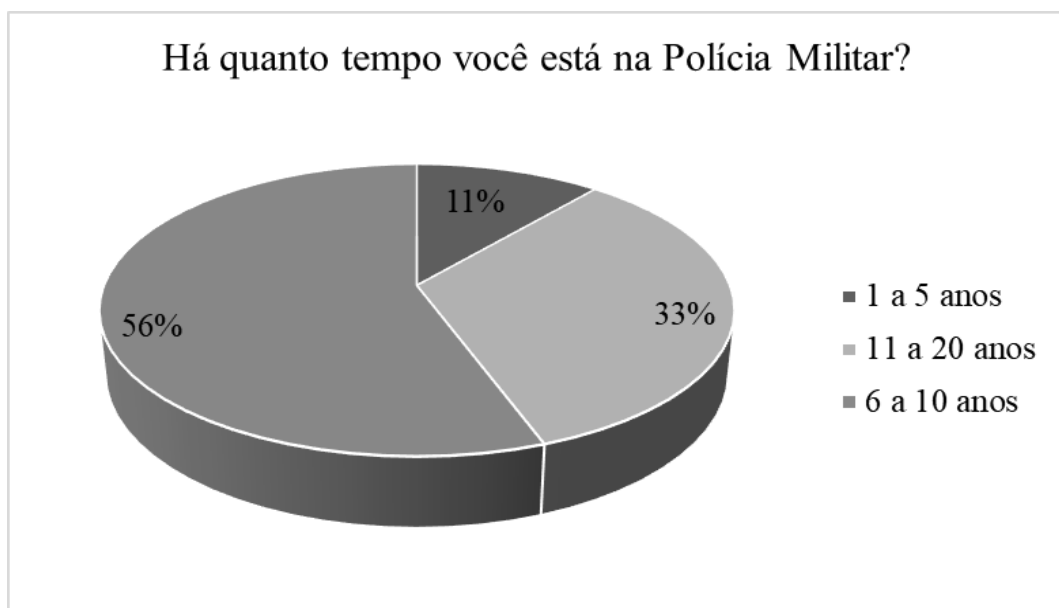
GRÁFICO 1 - Há quanto tempo você está na Polícia Militar?