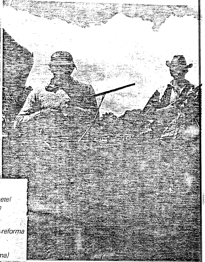
Vida por um fio Armas à mostra, que incluem coquetel Molotov, tomaram o lugar das foices e enxadas como símbolo da reforma agrária. O ânimo de luta está até nas crianças (acima)