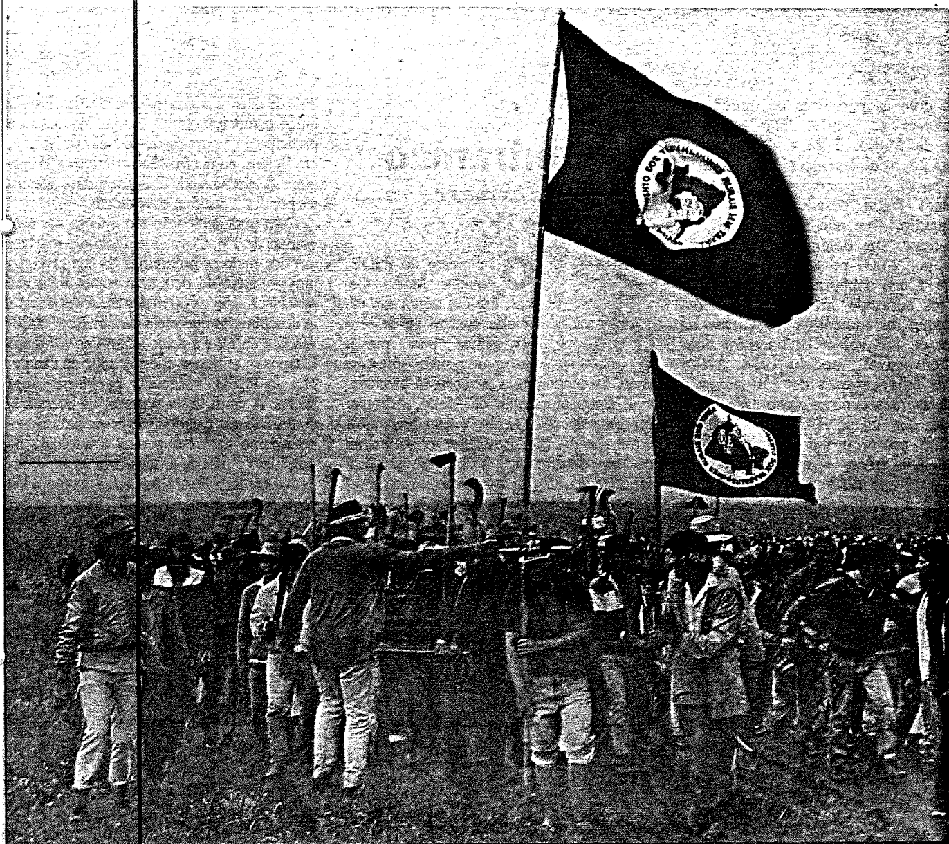
A retirada de invasores de terra no Rio Grande do Sul: idas e vindas de um conflito sem fim, envolvendo agricultores arruinados...