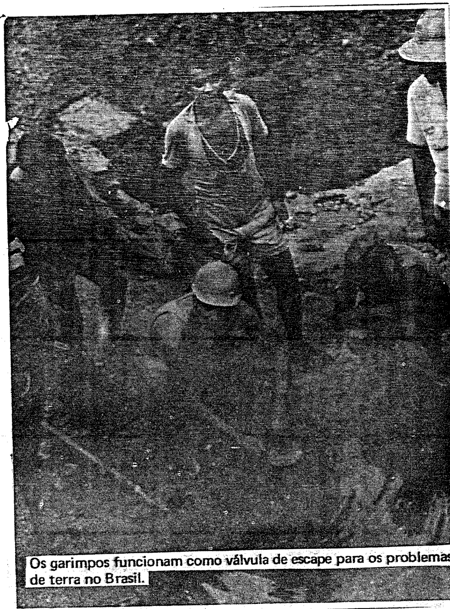
Os garimpos funcionam como válvula de escape para os problemas de terra no Brasil.