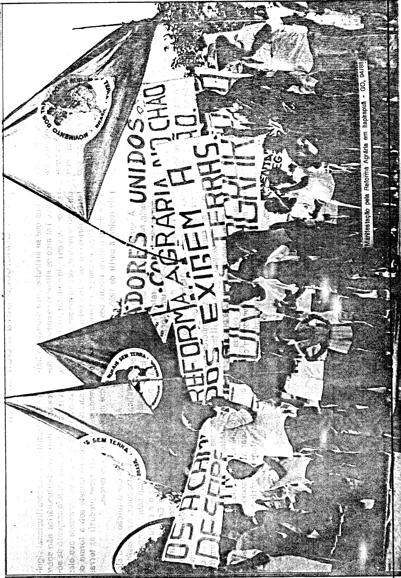
Manifestação pela Reforma Agrária em Itapirapua - GO, 04/88.