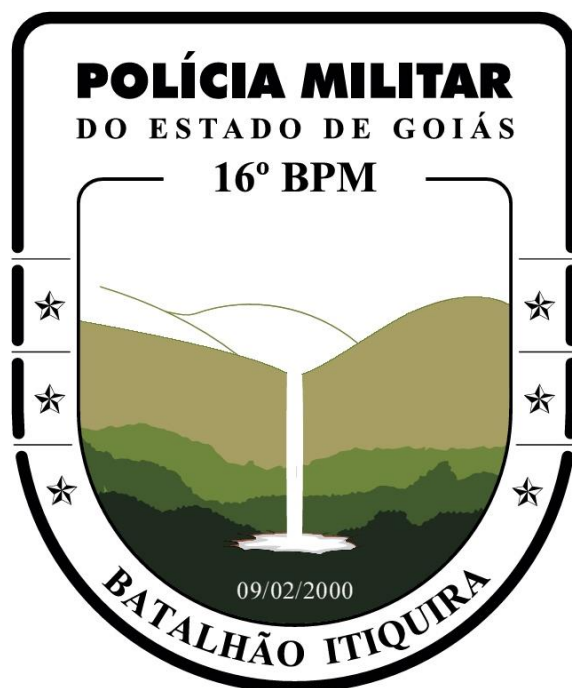
Figura 1: Brasão do 16º BPM