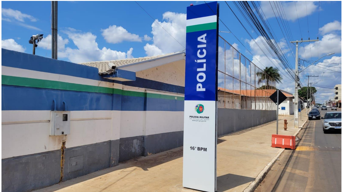
Figura 4: Fachada Atual da Unidade