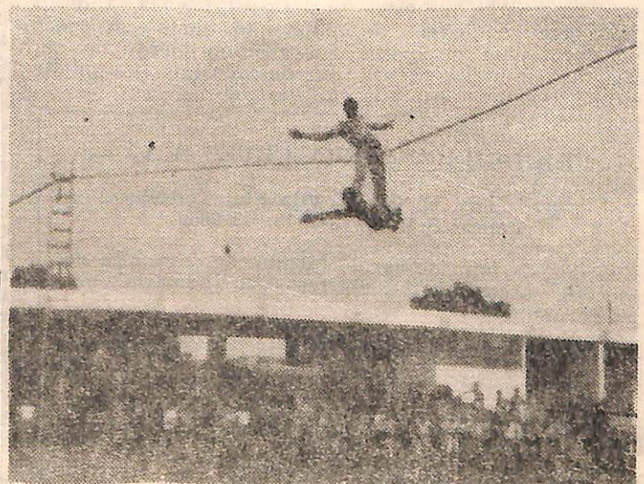
O Corpo de Bombeiros, Unidade co-irmã, também fez belíssimas demonstrações, durante as solenidades de formatura dos Cursos de Aperfeiçoamento de Sargentos, Formação de Sargentos e Formação de Cabos e ainda em comemoração ao dia da criança. Os bombeiros mostraram que realmente têm coragem e sangue frio.